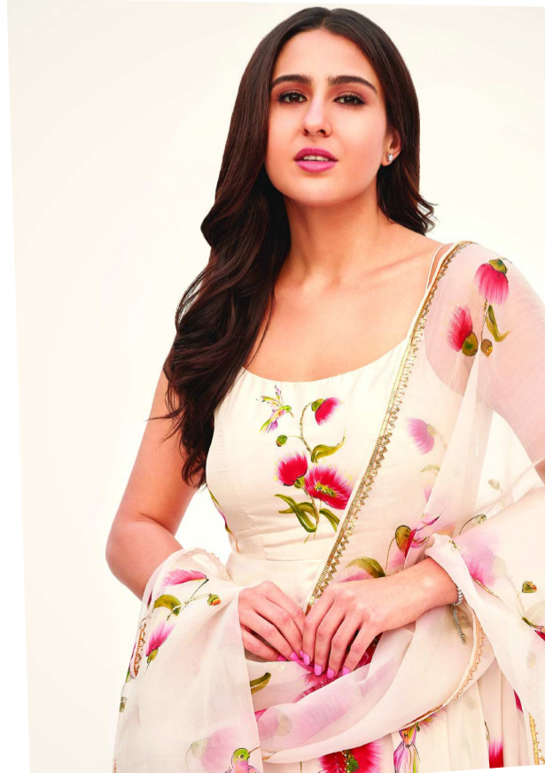
బాలీవుడ్ యంగ్ హీరోయిన్ సారా అలీ ఖాన్, రకుల్ ప్రీత్ సింగ్, వామికా గద్కర్, ఆయుష్మాన్ ఖురానా ప్రధాన పాత్రల్లో నటించిన తాజా

చిత్రం 'పతి పత్ని ఔర్ వో దో' ఇటీవల మే 15న విడుదలై, బాక్సాఫీస్ వద్ద మంచి వసూళ్లతో దూసుకుపోతోంది. నేటితరం ప్రేమకథలు, ఆధునిక వైవాహిక బంధాల్లో ఎదురయ్యే ఆచరణాత్మక సమస్యలను ఈ సినిమాలో ఎంతో ఆసక్తికరంగా చూపించడంతో ప్రేక్షకులకు ఇది బాగా కనెక్ట్ అవుతోంది. ఈ సినిమా ప్రమోషన్ లో భాగంగా తాజాగా ఇచ్చిన ఓ ఇంటర్వ్యూలో సారా అలీ ఖాన్ పెళ్లి బంధంపై తనకున్న ప్రాక్టికల్ ఆలోచనలను, తన వ్యక్తిగత అభిప్రాయాలను ఎంతో ఓపేన్ గా పంచుకున్నారు. తన వ్యక్తిగత జీవితంలో, చుట్టూపక్కల కొన్ని పెళ్లి బంధాలు విఫలమై విడిపోవడాన్ని కళ్లారా చూసిన సారా, వివాహం అనే వ్యవస్థను కేవలం ఊహల్లో చూసి తేలిపోసిన స్వప్నం చేశారు. మనం పెరిగిన వాతావరణం, మన చుట్టూ చూసే సంఘటనల నుంచే మన ఆలోచనలు పుడతాయని పేర్కొంటూ, హడావుడిగా పెళ్లి చేసుకుని బాధపడే కంటే కాస్త సమయం తీసుకుని సరైన వ్యక్తి దొరికే వరకు వేచి చూడటం ఎంతో ఉత్తమమని ఆమె అభిప్రాయపడ్డారు. ఒకవేళ తన జీవితంలోకి సరైన భాగస్వామి దొరకకపోతే, ఎవరికోసం తనను తాను మార్చుకోకుండా జీవితాంతం ఒంటరిగా ఉండటానికైనా సిద్ధమేనని సారా తెగేసి చెప్పారు. నన్ను ఎవరో వచ్చి సంపూర్ణంగా చేయాలి అవసరం లేదని, ఒక సంపూర్ణమైన మనిషిగా సొంతంగా ఎదగడానికే తాను ప్రాధాన్యత ఇస్తానని సారా ఈ సందర్భంగా స్పష్టం చేశారు. తనకంటూ ఉన్న ప్రత్యేక గుర్తింపును గౌరవస్తూ, తన సంతోషాన్ని పంచుకునే వ్యక్తి దొరికినప్పుడే పెళ్లి గురించి ఆలోచిస్తానని చెబుతూ, ప్రస్తుతానికి మాత్రం తన పూర్తి దృష్టి కేవలం కెరీర్, సొంత ఎదుగుదల, సినిమాలపైనే ఉందని ఆమె క్లారిటీ ఇచ్చారు.