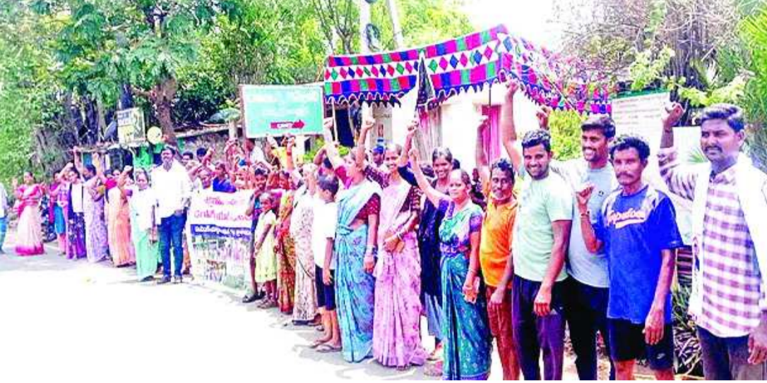
అక్షయవర్షం, పతాకం న్యూస్: కొత్తవలస నాయకులతో కలిసి అక్కడకు వచ్చిన అధికారులను డంపింగ్ యార్డు సమస్య చినికిచినికి గాలి వానలా అడ్డుకుని చెత్తతో వచ్చిన ట్రాక్టర్ ను తిరిగి పంపించేశారు. మారింది. రాజన్ కాలనీవాసులు జనసేన పార్టీ 56 రోజులుగా డంపింగ్ యార్డుపై నిరసన తెలిపినా