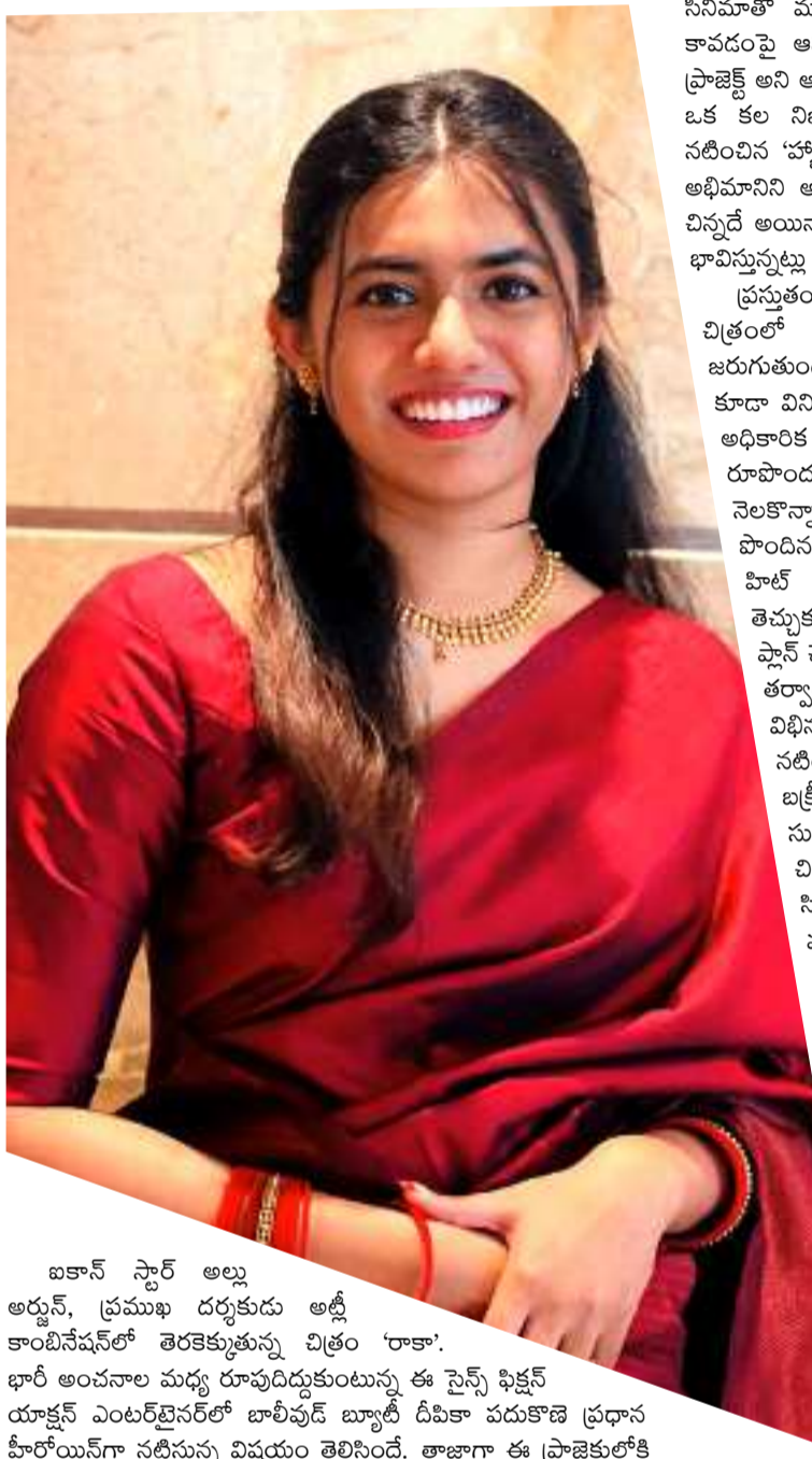
ఐకాన్ స్టార్ అల్లు అర్జున్, ప్రముఖ దర్శకుడు అశ్వి కాంచినేషన్లో తెరకెక్కుతున్న చిత్రం 'రాకా'. భారీ అంచనాల మధ్య రూపుదిద్దుకుంటున్న ఈ సైన్స్ ఫిక్షన్ యాక్షన్ ఎంటర్టైన్మెంట్ బాలీవుడ్ బ్యూటీ డీపికా పదుకొణె ప్రధాన హీరోయిన్గా నటిస్తున్న విషయం తెలిసిందే. తాజాగా ఈ ప్రాజెక్టులోకి మలయాళ నటి ఫేమీనా జార్జ్ కూడా అడుగుపెట్టారు. 'మిన్నల్ మురళి'

సినిమాతో మంచి గుర్తింపు తెచ్చుకున్న ఫేమీనా, 'రాకా'లో భాగం కావడంపై ఆనందం వ్యక్తం చేశారు. తన కెరీర్లోనే ఇది అతిపెద్ద ప్రాజెక్ట్ అని ఆమె తెలిపారు. అల్లు అర్జున్తో కలిసి స్క్రీన్ పంచుకోవడం ఒక కల నిజమైన క్షణమని ఆమె అభివర్ణించారు. అల్లు అర్జున్ నటించిన 'హ్యాపీ' సినిమా చూసినప్పటి నుంచి తాను ఆయనకు పెద్ద అభిమానిని అయిపోయానని ఫేమీనా పేర్కొన్నారు. తన పాత్ర నిడివి చిన్నదే అయినా, ఇంత భారీ చిత్రంలో అవకాశం రావడం అదృష్టంగా భావిస్తున్నట్లు వివరించారు.