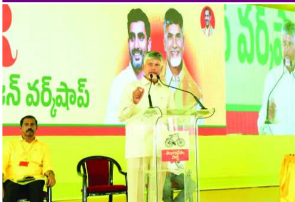
మంగళగిరి, పతాకం న్యూస్: మంగళగిరిలోని టీడీపీ కేంద్ర కార్యాలయంలో ఎమ్మెల్యేలు, ఎంపీలు, ఎమ్మెల్సీలు, నియోజకవర్గ ఇన్ ఛార్జ్ లు, పరిశీలకుల కోసం నిర్వహించిన ఎన్ బిఆర్