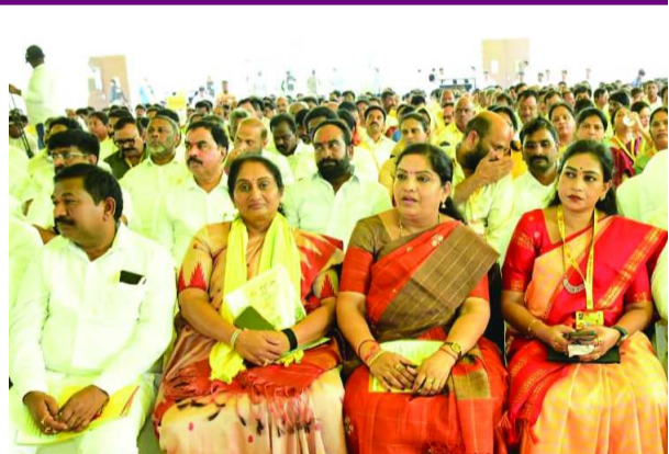
వర్క్ షాప్ లో సీఎం చంద్రబాబు కీలక వ్యాఖ్యలు చేశారు. ఈ నెల 4న ఎన్ టీఎం నేతల సమావేశం జరగనుందని తెలిపారు. రాష్ట్ర నియోజకవర్గ, జిల్లా స్థాయిలో (తరువాయి 2వ పేజీలో)