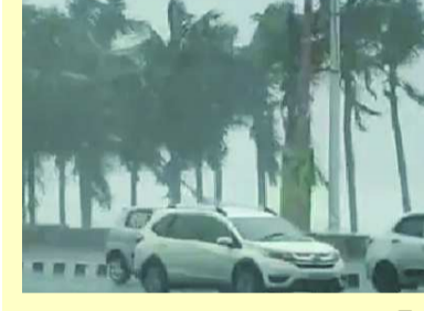
విశాఖపట్నం, పతాకం న్యూస్: వేసవి కాలం.. అందునా రోహిణి కార్తె కావడంతో ఎండలు మండిపోతున్నాయి. రాష్ట్రంలో రుతుపవనాల ప్రవేశానికి ఇంకా సమయం ఉందని ఇప్పటికే వాతావరణ శాఖ వెల్లడించింది. దీంతో తీవ్రమైన (తరువాయి 2వ పేజీలో)