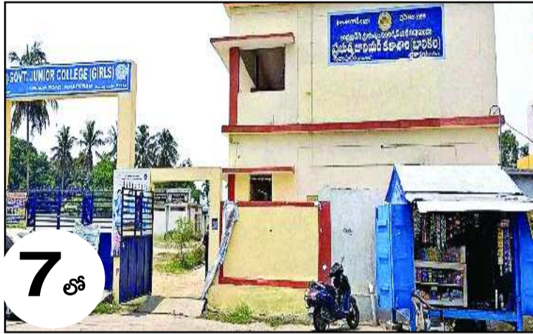
7 వ్రాభుత్వ జూనియర్ కళాశాలల్లో వ్యాయామ అధ్యాపకుల కొరత!

Visakhapatnam, Srikakulam, Allurisitarama, Rajamahendravaram, Vijayawada, Tirupati, Anathapuram