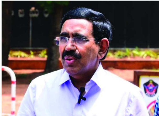
ప్రభుత్వం చెత్త పన్ను వసూలు చేసింది. అయినా 150 లక్షల టన్నుల చెత్తను వదిలి (తరువాయి 2వ పేజీలో)

ఎన్టీఆర్ జిల్లా, పతాకం న్యూస్: ఆంధ్రప్రదేశ్ లో మున్సిపాలిటీలను డంపింగ్ యార్డుల రహితంగా మార్చేందుకు కృషి చేస్తున్నామని మంత్రి పొంగూరు నారాయణ తెలిపారు. ప్రస్తుతం విశాఖపట్నం, గుంటూరులో 'వేస్ట్ టు ఎనర్జీ' ప్లాంట్లు ఉన్నాయని, కొత్తగా మరో ఆరు ప్లాంట్లను నెలకొల్పనున్నట్లు ఆయన పేర్కొన్నారు. ఈ లోగా 107 మున్సిపాలిటీల్లో ఉత్పత్తి అయ్యే చెత్త నిర్మూలన కోసం ఫ్రెష్ వేస్ట్ ప్లాంట్లు ఏర్పాటు చేస్తున్నట్లు వెల్లడించారు. ఈ ప్లాంట్ల ద్వారా ప్రతి రోజూ 5,385 టన్నుల చెత్తను కంపోస్ట్, బయోగ్యాస్ గా మారుస్తామని తెలిపారు. ఎన్టీఆర్ జిల్లా కొండపల్లి, ఇబ్రహీంపట్నంలో మంత్రి నారాయణ, ఎమ్మెల్యే వసంత కృష్ణ ప్రసాద్ పర్యటించారు. కొండపల్లిలో కొత్తగా నిర్మిస్తున్న ఫ్రెష్ వేస్ట్ ప్లాంట్ ను పరిశీలించగా, ఇబ్రహీంపట్నంలో కంపోస్ట్ బయోగ్యాస్ ప్లాంట్ ను పరిశీలించారు. ఈ సందర్భంగా మంత్రి నారాయణ మాట్లాడుతూ.. 'విపీ ప్రజల నుంచి గత