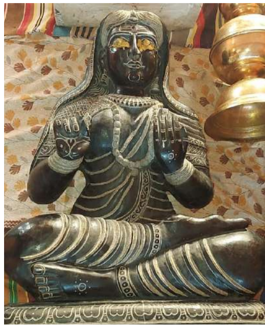
అనందం వ్యక్తం చేస్తున్నారు.

పంపిణీ చేపట్టడంతో ఆలయ ప్రాంగణం జన సందోహంతో తిలకింపబడుతోంది. ఈ మహోత్సవాన్ని విజయవంతం చేయడానికి ఆలయ కమిటీ సభ్యులు, గ్రామ పెద్దలు, యువకులు, మహిళలు సమిష్టిగా కృషి చేస్తున్నారు. భక్తుల రద్దీ రృష్టా ప్రత్యేక ఏర్పాట్లు కూడా చేపట్టారు. శ్రీ హేమారెడ్డి మల్లమ్మ ఆశీర్వాదంతో గ్రామానికి మరింత అభివృద్ధి, ప్రజలకు ఆయురారోగ్యాల కలగాలని భక్తులు ప్రార్థిస్తున్నారు. ఈ విగ్రహ ఆవిష్కరణ మహోత్సవం కంగ్డి గ్రామ చరిత్రలో చిరస్మరణీయ ఘట్టంగా నిలవనుందని గ్రామస్థులు