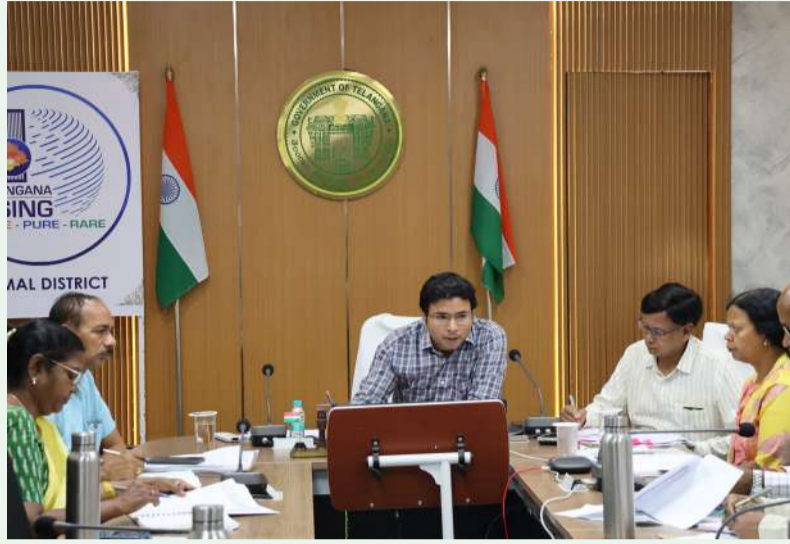
రాష్ట్ర ప్రభుత్వ ప్రధాన కార్యదర్శి రామకృష్ణారావు.

విజేత మామూలు: ప్రజాపాలన-ప్రగతి ప్రణాళిక లో భాగంగా ఈ నెల 11 వ తేదీ నుంచి 17 వ తేదీ వరకు విద్యా శాఖ వారోత్సవాలు విజయవంతంగా నిర్వహించాలని రాష్ట్ర ప్రభుత్వ ప్రధాన కార్యదర్శి రామకృష్ణారావు ఆదేశించారు. శనివారం సాయంత్రం, సీఎస్ రామకృష్ణారావు 99 రోజుల ప్రత్యేక ప్రణాళిక విద్యా వారోత్సవాలు, పరి ధాన్యం కొనుగోలు ప్రక్రియ, జనగణన సెల్ఫీ ఎన్వైవర్మెంట్, ఫార్మర్ రిజిస్ట్రీ, తదితర అంశాలపై, సంబంధిత శాఖల ఉన్నతాధికారులతో కలిసి హైదరాబాద్ నుంచి, ఆన్లైన్ జిల్లాల కలెక్టర్లు, ఇతర అధికారులతో కలిసి వీడియో కాన్ఫరెన్స్ ద్వారా సమావేశం నిర్వహించారు. ఈ వీడియో కాన్ఫరెన్స్ అనంతరం, జిల్లా