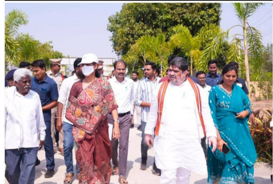
మండల కాంగ్రెస్ పార్టీ నాయకులు పాల్గొన్నారు.