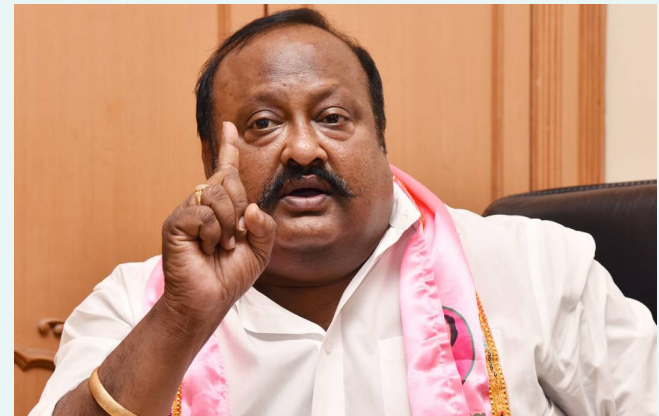
హైదరాబాద్, మే 13 ( తెలుగు రేఖ):

- ఇది కుల సమస్య కాదని గుర్తించాలన్న గంగుల