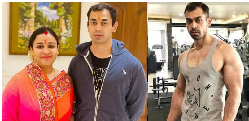
అక్టోబర్ 13 తెలుగురేఖ: