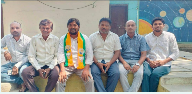
భీమదేవరపల్లి : మే 13 ( తెలుగు రేఖ)