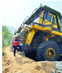
హైదరాబాద్, మే 14 తెలుగురేఖ: మహిళాశిఫార్డికి అధిక ప్రాధాన్యతనిస్తున్న తెలంగాణ రాష్ట్ర ప్రభుత్వం సింగరేణి సంస్థలో కూడా మహిళా శక్తికి తగ్గ ప్రాధాన్యతనిచ్చి ప్రోత్సహించాలని ఆదేశించడంతో సింగరేణి కార్యాలయం మహిళలకు కంపెనీ అవకాశం కల్పించేందుకు చర్యలు చేపట్టింది. రాష్ట్ర ముఖ్యమంత్రి రేవంత్ రెడ్డి, ఉప ముఖ్యమంత్రి భట్టి విక్రమార్కు ఆదేశంపై సింగరేణి యాజమాన్యం మహిళా డంపర్ ఆపరేటర్ల నియామకానికి తీరకారం