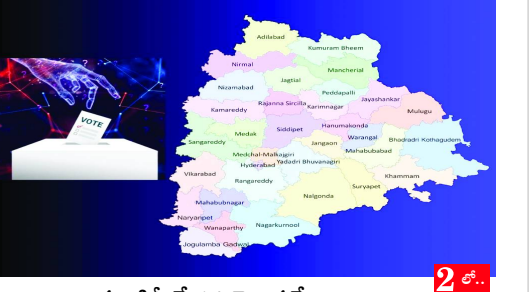
న్యూఢిల్లీ, మే 14 తెలుగురేఖ: దేశంలోని 16 రాష్ట్రాలు, 3 కేంద్ర పాలిత ప్రాంతాల్లో ఓటర్ల జాబితాల ప్రత్యేక విస్తృత సవరణ (సర్) మూడవ దశను