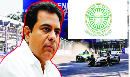
హైదరాబాద్, మే 14 తెలుగురేఖ: తెలంగాణలో సంచలనం రేపిన ఫార్మ్యూలా-ఈ రేస్ కేసులో కీలక పరిణామం చోటుచేసుకుంది. మాజీ మంత్రి, బీఆర్ఎస్ వర్సింగ్ ప్రెసిడెంట్ కేబీఆర్ తో పాటు పలువురు కీలక అధికారులకు ఏపీబీ ప్రత్యేక కోర్టు సమన్లు జారీ