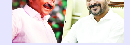
హైదరాబాద్, మే 14 తెలుగురేఖ: కేరళం ముఖ్యమంత్రిగా ఎంపికైన వీడి సతీషన్ కు తెలంగాణ సీఎం ఎ. రేవంత్ రెడ్డి శుభాకాంక్షలు తెలిపారు. ఈ మేరకు గురువారం ఆయన మీడియాకు ఒక ప్రకటన విడుదల చేశారు.

ఆయనకు పదవి దక్కడం సముచిత గుర్తింపు అని వెల్లడి