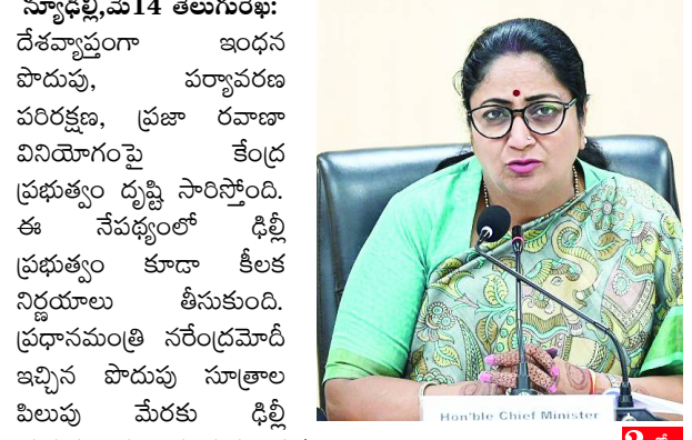
న్యూఢిల్లీ, మే 14 తెలుగురేఖ: దేశవ్యాప్తంగా ఇంద్రుని పాదుపు, పర్యావరణ పరిరక్షణ, ప్రజా రవాణా వినియోగంపై కేంద్ర ప్రభుత్వం దృష్టి సారినోంది. ఈ నేపథ్యంలో ఢిల్లీ ప్రభుత్వం కూడా కీలక నిర్ణయాలు తీసుకుంది. ప్రధానమంత్రి నరేంద్రమోడీ ఇచ్చిన పాదుపు సూత్రాల పిలుపు మేరకు ఢిల్లీ ప్రభుత్వం పలు సంస్కరణాత్మక