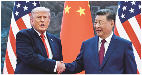
బీజింగ్, మే 14 తెలుగురేఖ: అమెరికా అధ్యక్షుడు డొనాల్డ్ ట్రంప్, చైనా అధినేత జిన్పింగ్ మధ్య