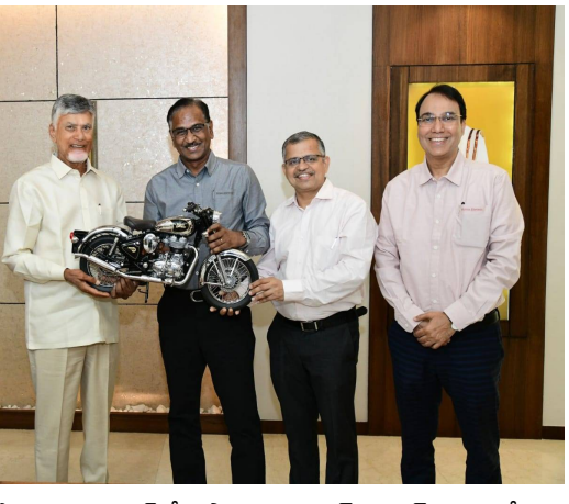
ఎ+లాలట్ పాటు టెస్టింగ్ ట్రాక్, పరిశోధనా కేంద్రం, వెండర్ పార్క్ ఏర్పాటు చేయనున్నట్లు వెల్లడించారు. దీంతో రాష్ట్రంలో ఆరోమోటైల్ రంగానికి కొత్త ఊపు రానుందని భావిస్తున్నారు. ఈ ఎ+లాలట్ ద్వారా ఏడాదికి సుమారు 9 లక్షల మోటార్ సైకిళ్లు ఉత్పత్తి చేయనున్నట్లు ఆ కంపెనీ ప్రతినిధులు తెలిపారు. అలాగే ఈ యూనిట్ ద్వారా ప్రత్యక్షంగా, పరోక్షంగా దాదాపు 15 వేల మందికి ఉద్యోగం, ఉపాధి అవకాశాలు లభించనున్నాయి. రాయల్ ఎన్ఫీల్డ్ త్వరలో 'స్పెయింగ్ ప్లీ ఆఫ్' పేరుతో ఎలక్ట్రిక్ వేరియంట్ మోడల్ ను కూడా మార్కెట్లోకి తీసుకురానున్నట్లు ఆ సంస్థ ప్రతినిధులు సీఎం చంద్రబాబుకు తెలిపారు. భవిష్యత్తులో ఎలక్ట్రిక్ వాహనాల తయారీలో కూడా ఏపీ కీలక కేంద్రంగా మారే అవకాశం ఉందని ప్రతినిధులు పేర్కొన్నారు.

అమరావతి, మే 18 (తెలుగు రేఖ): ఆంధ్రప్రదేశ్ లో ప్రముఖ ద్వీపక వాహన తయారీ సంస్థ రాయల్ ఎన్ఫీల్డ్ భారీ పెట్టుబడితో తయారీ యూనిట్ ఏర్పాటు చేయనుంది. ఈ నేపథ్యంలో ఏపీ ముఖ్యమంత్రి నారా చంద్రబాబు నాయుడుతో రాయల్ ఎన్ఫీల్డ్ సంస్థ ప్రతినిధులు సమావేశం రాష్ట్ర సచివాలయంలో సమావేశమయ్యారు. రాయల్ ఎన్ఫీల్డ్ సంస్థ సీఈఓ గోవింద్ రాజన్ నేతృత్వంలోని బృందం సీఎం చంద్రబాబు కలిసింది. ఈ సందర్భంగా బుల్లెట్ మోటార్ సైకిల్ మోడల్స్ ను సీఎం పరిశీలించారు. రాష్ట్రంలో పెట్టుబడులకు ప్రభుత్వం పూర్తి సహకారం అందిస్తుందని హామీ ఇచ్చారు. బు+లెటెట్ మోటార్ సైకిల్ తయారీ యూనిట్ కు ఏపీ ప్రభుత్వం ప్రోత్సాహకాలను కల్పించబడతే ఆ సంస్థ ప్రతినిధులు సీఎం చంద్రబాబుకు ధన్యవాదాలు తెలిపారు. తిరుపతి జిల్లా సత్యవేడు మండలం రాజ్ కుప్పం, వాసలూరు గ్రామాల వద్ద రూ.2500 కోట్ల పెట్టుబడితో రాయల్ ఎన్ఫీల్డ్ తయారీ ఎ+లాలట్ ఏర్పాటు చేయనున్నట్లు కంపెనీ ప్రతినిధులు వెల్లడించారు. ఈ ప్రాజెక్టును వేగంగా పూర్తి చేసి 18 నెలల్లోనే ఉత్పత్తి ప్రారంభించాలని సూచించారు. రాష్ట్రంలో పారిశ్రామిక అభివృద్ధి, పెట్టుబడుల ఆకర్షణలో ప్రభుత్వం వేగంగా ముందుకొందని సీఎం పేర్కొన్నారు. రాయల్ ఎన్ఫీల్డ్ వంటి అంతర్జాతీయ స్థాయి సంస్థలు ఏపీలో