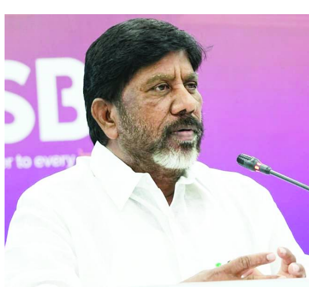
హైదరాబాద్,మే22 తెలుగురేఖ: ఇస్రోదని ఉప ముఖ్యమంత్రి భట్టి విక్రమార్క స్వస్థం చేశారు. శుక్రవారం మహారాష్ట్రా జ్యోతి రావు ఫూలే ప్రజాభవన్ లో జరిగిన