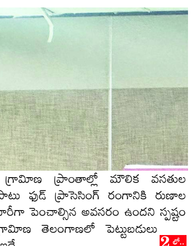
కాకుండా, గ్రామీణ ప్రాంతాల్లో మౌలిక వసతుల కల్పనతో పాటు ఫుడ్ ప్రాసెసింగ్ రంగానికి రుణాల పంపిణీని భారీగా పెంచాల్సిన అవసరం ఉందని స్పష్టం చేశారు. గ్రామీణ తెలంగాణలో పెట్టుబడులు పెట్టడానికి ఇదే

హైదరాబాద్,మే22 తెలుగురేఖ: తెలంగాణ రాష్ట్ర గ్రామీణ ఆర్థిక వ్యవస్థను మరింత బలోపేతం చేయడంలో బ్యాంకులు చురుకైన భాగస్వాములు కావాలని మంత్రి తుమ్మల నాగేశ్వరరావు విలుపునిచ్చారు. ప్రజా భవన్ లో నిర్వహించిన రాష్ట్ర స్థాయి బ్యాంకర్ల కమిటీ సమావేశంలో వ్యవసాయశాఖ మంత్రి తుమ్మల నాగేశ్వర రావు పాల్గొన్నారు. ఈ సందర్భంగా మంత్రి తుమ్మల మాట్లాడుతూ.. బ్యాంకర్లు కేవలం సాంప్రదాయ పంట రుణాలకే పరిమితం