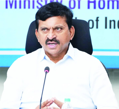
హైదరాబాద్, మే 23 తెలుగురేఖ: రాష్ట్రవ్యాప్తంగా హీట్ వేవ్పై హై అలర్ట్ ప్రకటించినట్లు తెలంగాణ రెవెన్యూ, సమాచారశాఖల మంత్రి పొంగులేటి