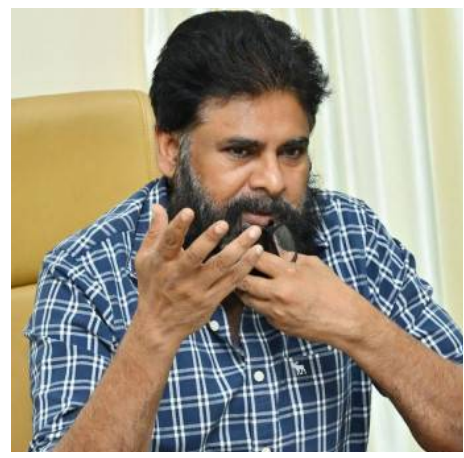
అమరావతి, మే4( తెలుగురేఖ):