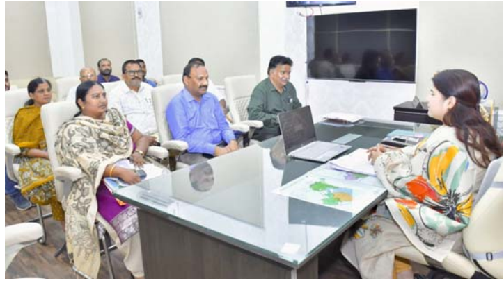
నంద్యాల, మే 21