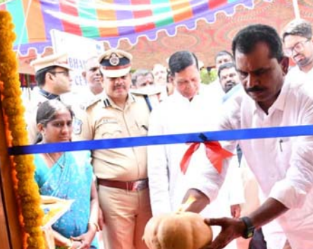
సూచించారు. హెల్త్ ఛెక్ వెల్డ్” అని పేర్కొంటూ ఆరోగ్యంపై శ్రద్ధ పెట్టాలని కోరారు. పాత భవనాలను పునరుద్ధరించి వినియోగించడం కూడా మంచి అలవాటని తెలిపారు. ప్రణాళికా సంఘం ప్రణాళికా క్రీడా వారోత్సవాల్లో భాగంగా నిర్వహిస్తున్న క్రీడా కార్యక్రమాలు యువతలో క్రీడాస్ఫూర్తిని పెంపొందిస్తాయని అన్నారు. ఆరోగ్యంగా ఉండాలంటే శారీరక దారుణ్యం ఎంతో అవసరమని తెలిపారు. నల్లచెరువు మినీ ట్యాంక్ బండ్ వద్ద రెండు జిమ్ కేంద్రాలు ఏర్పాటు చేసినట్లు వెల్లడించారు. పోక్సో కేసుల బాధితులకు ఒకే చోట న్యాయ సహాయం, మానసిక భరోసా కల్పించేందుకు తెలంగాణ ప్రభుత్వం 2018లో భరోసా కేంద్రాలను ప్రారంభించింది. ఈ విధానం ఇతర రాష్ట్రాలకు కూడా ఆదర్శంగా నిలిచిందని తెలిపారు. బాధితుల వివరాలను గోప్యంగా ఉంచుతూ వారికి అవసరమైన సహాయం అందించడం భరోసా కేంద్రాల ముఖ్య ఉద్దేశమని పేర్కొన్నారు. అలాగే జిల్లా