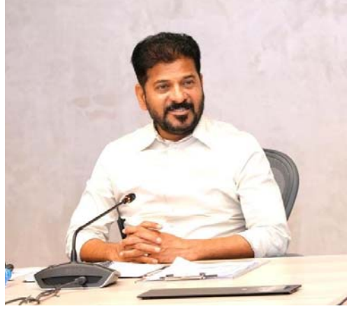
హైదరాబాద్ ప్రతినిధి, ఉదయం న్యూస్

పరిశ్రమల శాఖపై ముఖ్యమంత్రి రేవంత్ రెడ్డి ఎమ్సీహెచ్ఆర్డీలో సమీక్ష నిర్వహించారు. భారత్ వ్యూచర్ సీటీ ల్యాండ్ అలాట్రాంట్, పరిశ్రమల ఏర్పాటుపై చర్చించారు. నెట్ జీరో సీటీ తరహాలోనే వ్యూచర్ సీటీ డిజైన్స్ ఉండాలని సీఎం తెలిపారు. మౌలిక వసతుల కల్పన అంతర్జాతీయ స్థాయిలో ఉండాలి.. ఇందులో రాజీవ్ గాంధీ నిర్మాణం చేశారు. అంతర్జాతీయ స్థాయి నగరాలను అధ్యయనం చేయాలని ట్రంట్ ఇన్ఫ్రాస్ట్రక్చర్ అభివృద్ధి చేసిన తర్వాతే భూ కేటాయింపులు చేయాలని సూచించారు. అంతర్జాతీయ స్థాయి సంస్థలను వ్యూచర్ సీటీకి తీసుకువచ్చాలని సీఎం అన్నారు. వ్యూచర్ సీటీలో ప్రజాప్రతినిధులు, సివిల్ సర్వీస్ అధికారులు, జర్నలిస్టులకు 500 ఎకరాల కేటాయింపాలని సీఎం తెలిపారు. కేంద్రం ప్రకటించిన హెల్త్ క్లస్టర్లను వ్యూచర్ సీటీకి వచ్చేలా చర్యలు తీసుకోవాలని సూచించారు. అవసరమైతే ప్రధాని మోదీని కలిసి హెల్త్ క్లస్టర్ కేటాయింపాలని విజ్ఞప్తి చేద్దామని ముఖ్యమంత్రి అన్నారు. జూన్ లో వ్యూచర్ సీటీ ఆండ్రస్ట్రక్చర్ పార్క్ లో పరిశ్రమల ఏర్పాటుకు శంకుస్థాపన జరిగేలా చూడాలన్నారు. భూ కేటాయింపు జరిగిన వెంటనే పరిశ్రమలు నిర్మాణం మొదలు పెట్టేలా