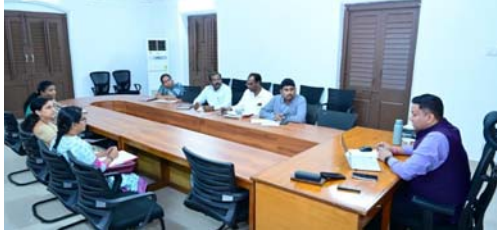
రాయచోటి, మే 21: ఉదయం ప్రతినిధి