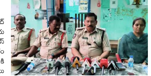
ఉదయం స్వాగతం ఆళ్లగడ్డ

పోలీస్ ఉన్నతాధికారుల ఆదేశాల మేరకు, రాజ్ పు బక్రీడ్ పండుగ సందర్భంగా ఆళ్లగడ్డ టోన్ పోలీస్ స్టేషన్ నందు ఆళ్లగడ్డ ఎస్ టి ఓ. మరియు సి ఐ ఆళ్లగడ్డ టోన్ పోలీస్ అధ్యక్షతన శాంతి కమిటీ సమావేశం నిర్వహించడమైంది. ఈ సమావేశంలో ఆళ్లగడ్డ పట్టణానికి చెందిన అన్ని వర్గాల కమ్యూనిటీ పెర్సన్లు, మత పెద్దల మరియు గౌరవ ప్రముఖులు పాల్గొన్నారు. సమావేశంలో బక్రీడ్ పండుగను శాంతియుతంగా జరుపుకోవడం గురించి చర్చించడమైంది. పట్టణంలో మత సామరస్యాన్ని, శాంతి భద్రతలను కాపాడటానికి పోలీస్ శాఖకు పూర్తి సహకారం అందిస్తామని పాల్గొన్న వారందరూ హామీ ఇచ్చారు.