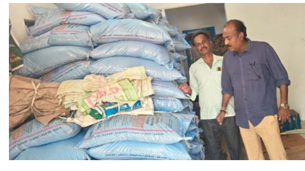
ఉదయం న్యూస్ వనపర్తి

రాంపల్లి క్రాన్ రోడ్ నందు ఫర్టిలైజర్ షాపును తనిఖీ చేసిన ఏవో.