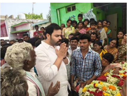
ఉదయం స్వాగతం చాగలమర్రి