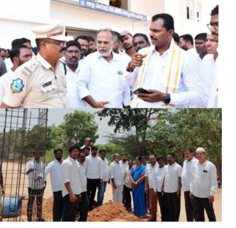
ఉదయం స్వాగతం వనపర్తి