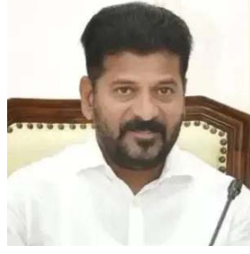
ఉదయం న్యూస్ వనపర్తి

తెలంగాణ ప్రభుత్వం కీలక నిర్ణయం తీసుకుంది కొత్త పెన్షన్లు ఇందిరమ్మ ఇళ్లు, రేషన్ కార్డుల కోసం నిరీక్షిస్తున్న వారికి తీపి కబురు అందించింది. ఇప్పటికే వీటి కోసం దరఖాస్తు చేసినవారి ప్రభుత్వ నిర్ణయం కోసం వేచి చూస్తున్న వారి సంఖ్య గణనీయంగా ఉంది. కాగా, బడ్జెట్ లో ఇప్పటికే ప్రకటించిన రెండు లక్షల పెన్షన్లతో పాటుగా రేషన్ కార్డుల పంపిణీకి ప్రభుత్వం ముహూర్తం నిర్ణయించింది. దరఖాస్తులు అర్హతల పై నిర్ణయం తీసుకుంది. ఇదే సమయంలో ప్రభుత్వం వీటికి సంబంధించి మరో ముఖ్య నిర్ణయంతో ముందుకు వెళ్ళింది. తెలంగాణలో కొత్త పెన్షన్లు, ఇందిరమ్మ ఇళ్లు, రేషన్ కార్డుల కోసం వేచి చూస్తున్న అర్హులకు ప్రభుత్వం కీలక అప్డేట్ ఇచ్చింది. తెలంగాణ అవతరణ దినోత్సవం సందర్భంగా జూన్ 2 నుంచి రెండు లక్షల మందికి కొత్త పింఛన్ల మంజూరు చేస్తామని కార్యక్రమం, గనుల శాఖ మంత్రి గడ్దం విజే ప్రకటించారు. పదేళ్ల కాలంలో బీఆర్ఎస్ ప్రభుత్వం అర్హులైన వారికి పింఛన్లు మంజూరు చేయలేదని ఆరోపించారు. రాష్ట్రంలో నూతనంగా 2లక్షల మందికి పింఛన్లు మంజూరు కోసం బడ్జెట్లో కేటాయింపులు జరిగిందని పేర్కొన్నారు.