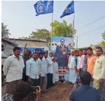
ఉదయం న్యూస్ వనపర్తి