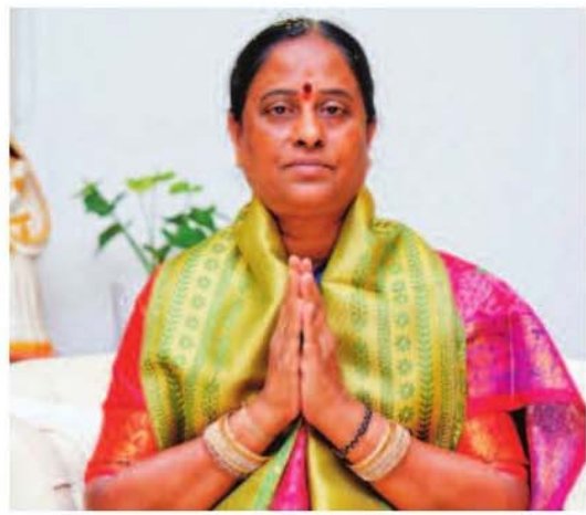
జిల్లాలోని భద్రాచలం వరకు దేవాలయాలను అభివృద్ధి చేస్తామని తెలిపారు. గురువారం నుంచి జయశంకర్ భూపాలపల్లి జిల్లా మహావేదపూర్ మండలం కాశీశ్రవణంలోని త్రివేణి సంగమం వద్ద సరస్వతి నది అంత్య పుష్కరాలు ప్రారంభం కానున్నాయి. మే 21 నుంచి జూన్ 1వ తేదీ వరకు మొత్తం 12 రోజుల పాటు ఈ అంత్య పుష్కరాలు జరుగుతున్నాయి.