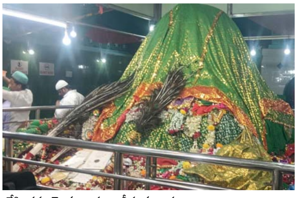
హోళిగుండ్ల, ఉదయం స్వాగతం

మండల పరిధిలో గురువారం సందర్భంగా రాష్ట్రానికి ప్రసిద్ధి గాంచిన శ్రీ శ్రీ హాజుర్త్ శేక్రపలి, పాపాపలి తాత దర్గాలో భక్తులు ప్రత్యేక ఫాతెహాల్ నిర్వహించారు. అలాగే భక్తులు మన రాష్ట్రం నుంచి కాక కర్ణాటక, తెలంగాణ నుంచి భక్తులు పెద్ద సంఖ్యలో వచ్చి తాతకు ప్రత్యేక ఫాతెహాల్ నిర్వహించి అనంతరం పార్శనలు చేసి తమ మొక్కు బదులు తీర్చుకున్నారు.