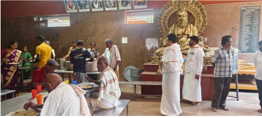
బ్రహ్మంగారిమఠం ఉదయం ప్రతినిధి

పుణ్యక్షేత్రమైన బ్రహ్మంగారిమఠంలో గురువారం రోజు ఉదయం 5.30 సమయంలో జగద్గురు శ్రీమద్విశ్వనాథ చోళూలూ వీరబ్రహ్మేంద్ర స్వామిల వారి మఠం మరాఠీపతులు వీరధర్మజుల వేంకటాద్రిస్వామిల స్వామిలవారు మఠం మాడవీధులను మరియు రథం పరిసర ప్రాంతాలను, టీటీడీ రూములను, టీటీడీ పరిసర ప్రాంతాలను మరియు కళ్యాణ కట్ట పరిసర ప్రాంతాలను, నిత్యాస్తుదాన పరిసర ప్రాంతాలను ఆకస్మికంగా వెళ్లి తనిఖీ చేసి ఎప్పటికప్పుడు ప్రతిరోజు మఠం పరిసర ప్రాంతాలన్నీ కూడా శుభ్రంగా ఉంచాలని అక్కడ ఉన్నటువంటి మఠం సిబ్బందికి ఆదేశించడం జరిగినది. అలాగే మధ్యాహ్నం వేళలో ప్రతిరోజు జరిగే నిత్య అన్నదాన సత్కారాన్ని కూడా మరాఠీపతులు తనిఖీ చేశారు అక్కడ భోజనం చేస్తున్న భక్తాదులతో కలిసి భోజనంతోపాటు కూరలు ఎలా ఉన్నాయని స్వయంగా భక్తులను అడిగి తెలుసుకున్నారు. అదేవిధంగా అన్నదాన సత్కారంలో పనిచేసే సిబ్బందిని భక్తులకు జాగ్రత్తగా అన్ని రకాల రుచులతో పంటలను పంపిణీ చేయాలని ఆయన ఆదేశించారు. అదేవిధంగా భక్తులు అన్నదానానికి సమర్పించే విరాళాలు వాటి వివరాలను అక్కడ ఉన్న సిబ్బంది దగ్గర రసీదులను ఆయన పరిశీలించి చూశారు. ఈ సందర్భంగా ఆయన మాట్లాడుతూ రాజీవ్ రోజుల్లో భక్తులకు అన్ని రకాల రుచికరమైన పంటకాలతో నాణ్యమైన ఉచిత భోజనాన్ని అందజేస్తామని మరాఠీపతులు శ్రీశ్రీ శ్రీ వీర ధర్మజుల వెంకటాద్రి స్వామిలవారు తెలిపారు. కార్యక్రమంలో దేవాలయ సిబ్బంది ప్రజలు తదితరులు పాల్గొన్నారు.