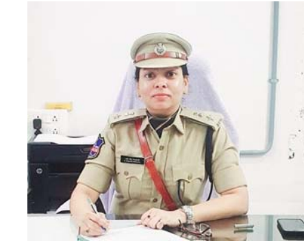
ఉదయం 8:00 గంటల నుండి సాయంత్రం 6:00 గంటల వరకు అమలులో ఉంటాయి. పరీక్ష కేంద్ర పరిసరాల్లో కర్రలు, రాళ్లు, ఆయుధాలు లేదా ఇతర ప్రమాదకరమైన వస్తువులు కలిగి ఉండటం నేరం. అలాగే, ఎగ్జిజిబిషన్ మెటీరియల్ను సంబంధించిన