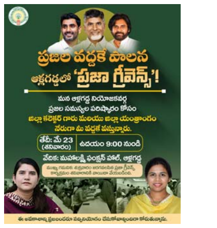
ఉదయం స్వాగతం ఆళ్లగడ్డ

ప్రజల సమస్యలను నేరుగా తెలుసుకొని వెంటనే పరిష్కరించే లక్ష్యంతో మే 23 తేదీన రోజు ప్రజా సమస్యల పరిష్కార వేదికను ఆళ్లగడ్డ పట్టణంలోని మహాలక్ష్మి ఫంక్షన్ హాల్ నందు నిర్వహించడం జరుగుతుంది. ఈ కార్యక్రమంలో ఎమ్మెల్యే భూమా అఖిలప్రియ మరియు జిల్లా కలెక్టర్ పాల్గొని ప్రజల సుండి నేరుగా వినతులను స్వీకరించనున్నారు. ఏ సమస్యలైనా ఉన్న ప్రజలు స్వయంగా హాజరై తమ అర్జీలను అందజేసి సమస్యలను పరిష్కరించుకోవలసిందిగా ఎమ్మెల్యే భూమా అఖిలప్రియ తెలిపారు. ప్రజల సమస్యల పరిష్కారమే లక్ష్యంగా ప్రభుత్వం పనిచేస్తోందని, ప్రతి సమస్యకు స్పందించి తక్షణగతిన పరిష్కారం చూపేందుకు ఈ వేదిక ఉపయోగపడుతుందని తెలిపారు. కావున ప్రజలందరూ ఈ అవకాశాన్ని వినియోగించుకొని కార్యక్రమానికి హాజరై తమ సమస్యలను తెలియజేయవలసిందిగా విజ్ఞప్తి చేయడమైంది.