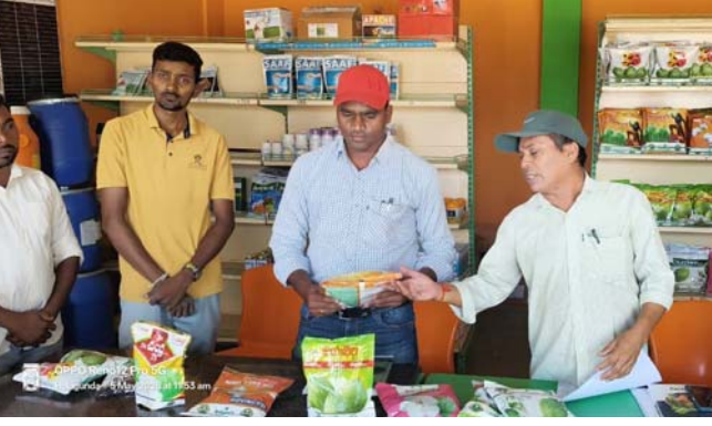
విత్తనాలు అమ్మినా అటువంటి డీలర్స్ పై కఠిన చర్యలు తీసుకుంటామని హెచ్చరించారు. అదే విధంగా రైతులకు ప్రతి కొనుగోలుపై