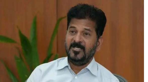
గన్పాయింట్ దోపిడీపై సీఎం రేవంత్ రెడ్డి ఫుల్ ఫోకస్ 2 కోట్ల ప్రావర్తి దొంగతనం...50 గంటలు గడిచినా జాడ లేదు! హైదరాబాద్ ప్రతినధి, ఉదయం న్యూస్

విజయవాడ కేంద్రంలోని 150 సీట్లను భర్తీ చేసామని ఆయన తెలిపారు. దరఖాస్తు రుసుము యస్సీ / యస్టీ వారు 250 రూపాయలు, ఇతరులు 500 రూపాయలు చెల్లించాలన్నారు. ఈ కోర్సులను పూర్తిచేసిన వారికి ప్లాస్టిక్ రంగంలో గల బహుళ జాతి సంస్థ(యుయస్సీ) అనుబంధ సంస్థలో జూనియర్ ఇంజనీర్ (ప్రాడక్షన్), మోల్డ్ డిజైన్ & మేకర్, జూనియర్ ఇంజనీర్ (మైంటెనెన్స్), క్వాలిటీ కంట్రోల్ విభాగాలలో ఇన్స్పెక్టర్