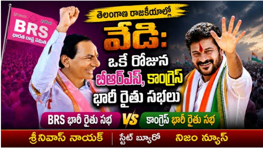
హైదరాబాద్ ప్రతినధి, ఉదయం న్యూస్