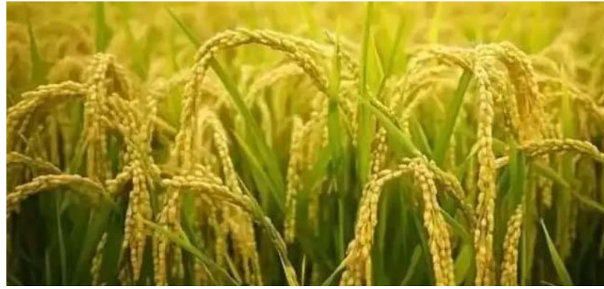
హైదరాబాద్ ప్రతినధి, ఉదయం న్యూస్

తెలంగాణలోని పలు జిల్లాల్లో కురుస్తున్న అకాల వర్షాలు మరియు భారీ వేసవి బిల్లుల నేపథ్యంలో, రైతులు నష్టపోకుండా ఉండేందుకు రాష్ట్ర నీటిపారుదల మరియు పౌరసరఫరాల శాఖ మంత్రి ఎన్. ఉత్తమ్ కుమార్ రెడ్డి అధికారులను అప్రమత్తం చేశారు. అత్యవసర సమీక్షా సమావేశంలో, ధాన్యం సేకరణ ప్రక్రియను వెంటనే వేగవంతం చేయాలని ఆయన ఆదేశించారు. ఒకవైపు ధాన్యం రాక పెరగడం, మరోవైపు ఈ వారం అంతా వర్షాలు కురిసే అవకాశం ఉండన్న వాతావరణ శాఖ హెచ్చరికల నేపథ్యంలో ప్రభుత్వ యంత్రాంగం హై అలర్ట్లో ఉంది. ప్రస్తుత రబీ మార్కెటింగ్ సీజన్లో ఇప్పటివరకు రాష్ట్రవ్యాప్తంగా 14.80 లక్షల మెట్రిక్ టన్నుల ధాన్యాన్ని సేకరించినట్లు ప్రభుత్వం వెల్లడించింది. రాష్ట్రంలోని మొత్తం 8,575 కొనుగోలు కేంద్రాలు పూర్తిస్థాయిలో పనిచేస్తున్నాయని, ఇప్పటివరకు 1.84 లక్షల మంది రైతుల నుండి ధాన్యం కొనుగోలు చేసినట్లు మంత్రి తెలిపారు. రైతులకు చెల్లింపుల విషయంలో కూడా ప్రభుత్వం వేగంగా చర్యచేస్తోంది, ఇప్పటికే రూ. 2,001.96 కోట్లను నేరుగా రైతుల ఖాతాల్లో జమ చేసింది. గత రాత్రి కురిసిన భారీ వర్షాలకు నల్గొండ, మహబూబ్ నగర్, ఖమ్మం వంటి జిల్లాల్లోని కొనుగోలు కేంద్రాల్లో ధాన్యం తడిసిపోయింది. ముఖ్యంగా నల్గొండలో సుమారు 300 మెట్రిక్ టన్నుల ధాన్యం నీటిపారుదల. ఈ నష్టాన్ని నివారించేందుకు ప్రభుత్వం కొన్ని కీలక చర్యలను అమలు చేసింది. తడిసిన ధాన్యాన్ని వెంటనే కేటాయించిన పారాబాయిల్డ్ రైస్ మిల్లులకు తరలించాలని, వాతావరణ హెచ్చరికల ప్రకారం ప్రతి కొనుగోలు కేంద్రం వద్ద తగినన్ని తార్పాలిష్టను అందించాలని ఉంచాలని కలెక్టర్లకు ఆదేశాలు జారీ అయ్యాయి. అదనంగా, జిల్లాల్లో 16 లక్షల మెట్రిక్ టన్నుల ధాన్యం ఉంచేలా బిగ్ స్టోరేజ్ సామర్థ్యాన్ని కూడా సిద్ధం చేశారు.