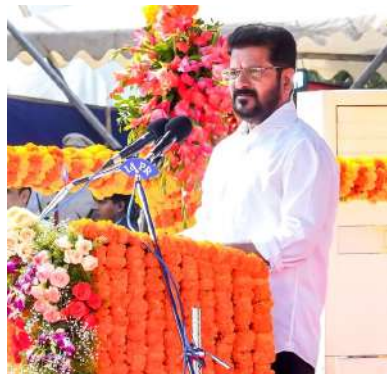
వేద న్యూస్, తెలంగాణ బ్యూరో

స్వరాష్ట్ర అస్తిత్వం కోసం దశాబ్దాల పాటు సాగిన ఉద్యమ పోరాటాలు, వేలాది మంది అమరవీరుల త్యాగాల ఫలితమే తెలంగాణ రాష్ట్ర ఆవిర్భావమని ముఖ్యమంత్రి రేవంత్ రెడ్డి పేర్కొన్నారు. తెలంగాణ ఆవిర్భావ దినోత్సవం సందర్భంగా సికింద్రాబాద్ పరేడ్ గ్రౌండ్స్లో నిర్వహించిన రాష్ట్ర స్థాయి వేడుకల్లో పాల్గొన్న ఆయన భద్రతా దళాల కమాన్సుల పరిశీలించి పోలీసుల