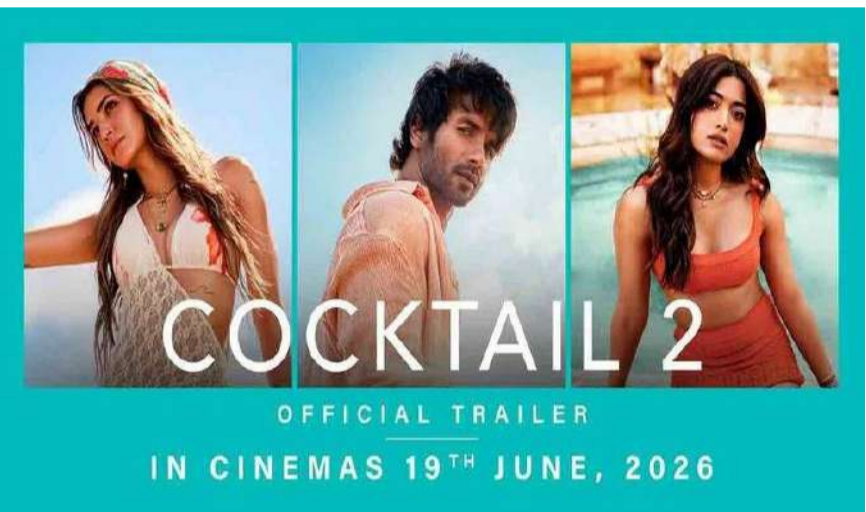
వేద న్యూస్ డెస్క్: