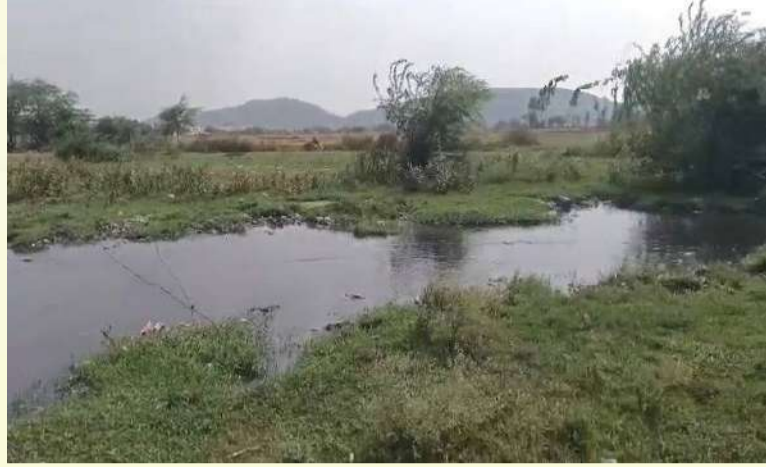
వేద న్యూస్, రాజన్న సిరిసిల్ల:

రాజన్న సిరిసిల్ల జిల్లా కేంద్రంలోని శాంతినగర్ డబుల్ బెడ్రూమ్ ఇళ్ల సమీపంలో నిర్మించిన తుమ్మలకుంట మురికినీటి శుద్ధి కేంద్రం (ఎస్టీపీ) పనులు పూర్తయినప్పటికీ ఇప్పటివరకు ప్రారంభానికి నోచుకోవడంతో స్థానిక రైతులు తీవ్ర ఇబ్బందులు ఎదుర్కొంటున్నారు. గత ప్రభుత్వ హయాంలో రూ.61.50 కోట్ల వ్యయంతో 6 ఎకరాల విస్తీర్ణంలో ఈ కేంద్రాన్ని నిర్మించినప్పటికీ అధికారుల నిర్లక్ష్యం కారణంగా అది నిరుపయోగంగా మారినది రైతులు ఆవేదన వ్యక్తం చేస్తున్నారు.