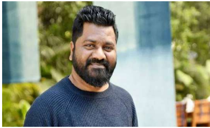
వేద న్యూస్ డెస్క్: