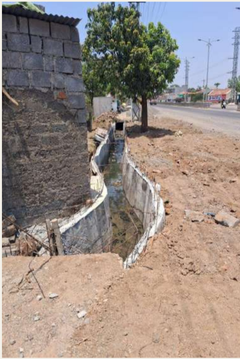
వేద న్యూస్, చొప్పదండి :

చొప్పదండి పట్టణంలో జరుగుతున్న డ్రైనేజీ నిర్మాణ పనుల్లో నాణ్యత లోపాలు వెలుగుచూస్తున్నాయి. నిర్మాణం పూర్తికాకముందే డ్రైనేజీ గోడ ఒకవైపుకు ఒరిగిపోవడంతో స్థానికులు తీవ్ర ఆందోళన వ్యక్తం చేస్తున్నారు. పునాది సరిగా వేయకపోవడం, కాంక్రీట్ నాణ్యత లోపించడం, సరైన క్యూరింగ్ చేయకపోవడం వల్లే గోడ వంగిపోయిందని స్థానికులు ఆరోపిస్తున్నారు. వర్షాకాలంలో నీటి ప్రవాహానికి ఈ గోడ కూలిపోయే ప్రమాదం ఉందని ఆందోళన వ్యక్తం చేస్తున్నారు. డ్రైనేజీ నిర్మాణంలో ఎక్కడికక్కడ అసమానంగా గోడలు నిర్మించడం, కొన్ని చోట్ల ఇసుక రాళ్లు బయటపడటం, స్లాబ్ లు బలహీనంగా ఉండటం వంటి అంశాలపై ప్రజలు అభ్యంతరం వ్యక్తం చేస్తున్నారు. హైటెన్షన్ విద్యుత్ స్తంభాల పక్కనే భద్రతా ప్రమాణాలు పాటించకుండా తవ్వకాలు చేపట్టడం ప్రమాదకరమని అంటున్నారు. పనులు ప్రారంభించి నెలలు గడుస్తున్నా పూర్తి చేయకపోవడంతో రోడ్లపై మట్టి గుట్టలు పేరుకుపోయి వాహనదారులు ఇబ్బందులు ఎదుర్కొంటున్నారు. మురుగు నీరు నిలిచి దుర్వాసన, దోమల సమస్య పెరిగిందని స్థానికులు వాపోతున్నారు. ఒరిగిపోయిన గోడను వెంటనే తొలగించి నిబంధనల ప్రకారం నాణ్యతతో మట్టి నిర్మించాలని, సంబంధిత అధికారులు పనులను సాంకేతికంగా పరిశీలించాలని ప్రజలు డిమాండ్ చేస్తున్నారు.