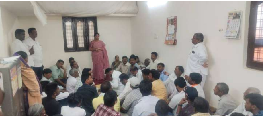
వేద న్యూస్, రుద్రూర్ :

- డబుల్ బెడ్ రూమ్ ఇళ్లు, ఇళ్ల స్థలాలపై చర్చ