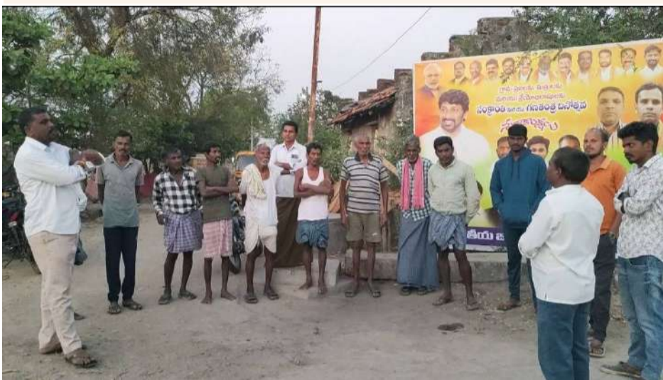
వేద న్యూస్, మందమల్ర: