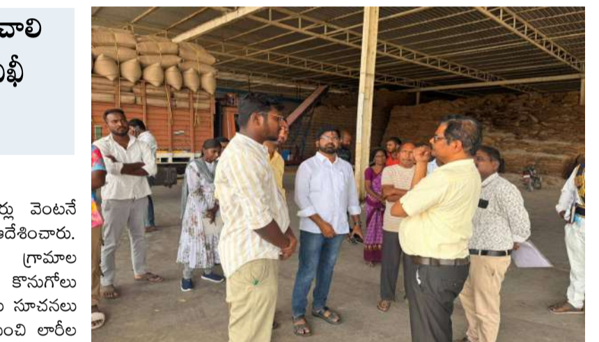
రైస్ ఇండస్ట్రీస్ ను ఆకస్మికంగా తనిఖీ చేసి అన్ లోడింగ్, హమాల్ ల సంఖ్య పెంపు తదితర అంశాలపై మిల్లర్లకు సూచనలు చేశారు.