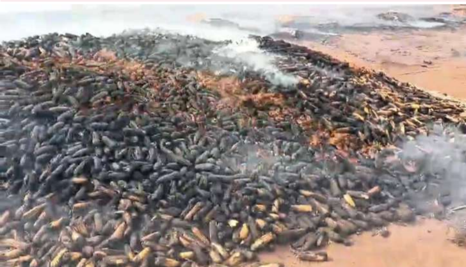
వేద న్యూస్, నల్లబెల్లి :