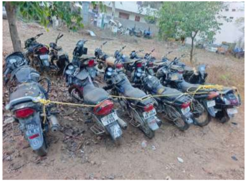
వేద న్యూస్, రాజన్న సిరిసిల్ల: