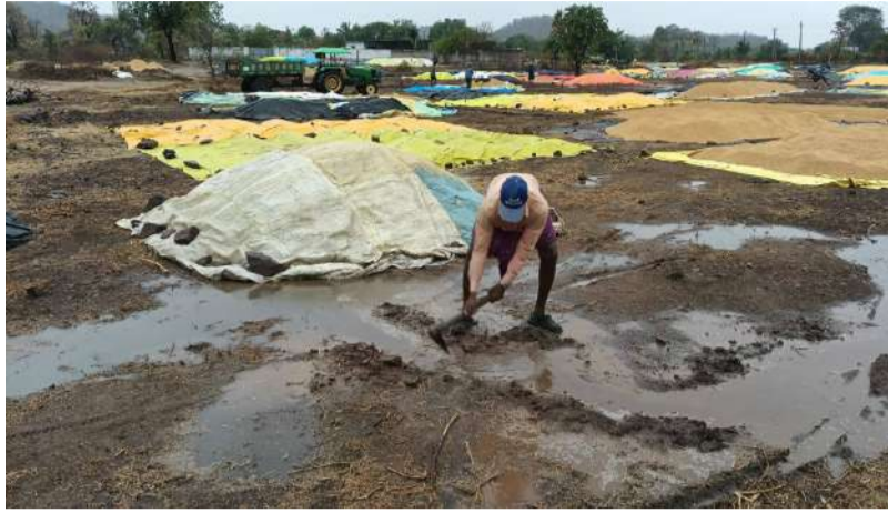
వేద న్యూస్, ఇట్రహింపట్లం :

ఇట్రహింపట్లం మండల కేంద్రంలో గురువారం సాయంత్రం ఈదురుగాలులు, ఉరుములతో కూడిన అకాల వర్షం కురవడంతో రైతులకు భారీ నష్టం వాటిల్లింది. రైతు మార్కెట్లలో నిల్వ ఉంచిన ధాన్యం తడవడంతో పాటు పంటలు నేలకూలిపోయాయి. ఆరుగాలం కష్టపడి సాగుచేసిన వరి, మొక్కజొన్న పంటలు కళ్లముందే దెబ్బతినడంతో రైతులు ఆవేదన వ్యక్తం చేస్తున్నారు. ధాన్యాన్ని కాపాడేందుకు తార్పాలిన్ కవర్లు వేసినా ఫలితం లేకపోయిందని రైతులు వాపోతున్నారు. వాతావరణ శాఖ హెచ్చరికలు ఉన్నప్పటికీ తీవ్ర ఎండల తర్వాత ఒక్కసారిగా కురిసిన వర్షం రైతుల కుటుంబాల్లో విషాదం నింపింది. ఇప్పటికే భారీ పెట్టుబడులు పెట్టిన రైతులు ఇప్పుడు ఆర్థికంగా తీవ్ర ఇబ్బందులు ఎదుర్కొంటున్నారు.