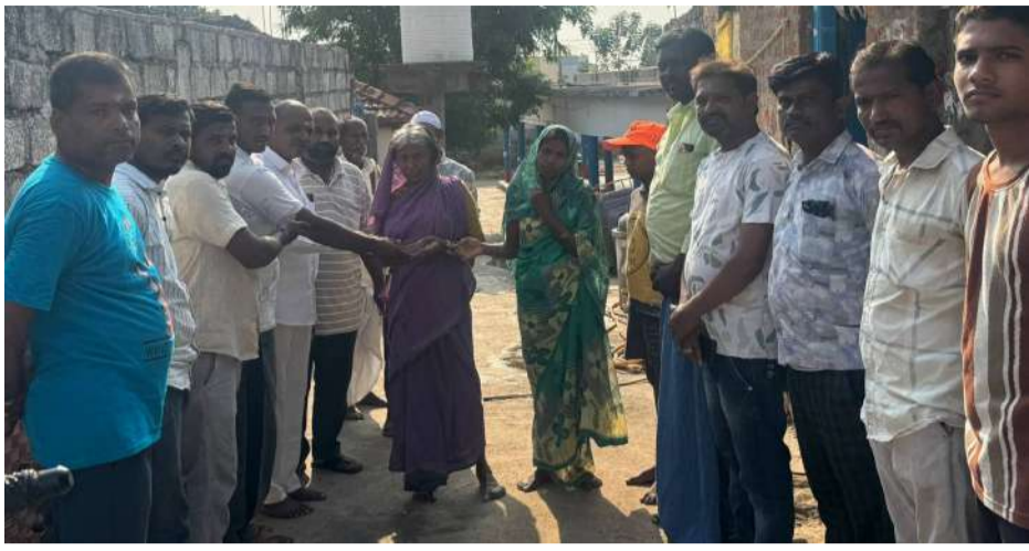
వేద న్యూస్, కోటగిరి:

- మానవత్వం చాటుకున్న గ్రామ పెద్దలు, యువత