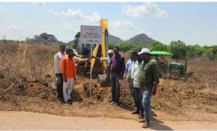
వేద న్యూస్, పెద్దపల్లి:

ప్రభుత్వ భూములపై అక్రమ కట్టడాలు, నకిలీ పత్రాలతో రిజిస్ట్రేషన్లు చేసిన వారు స్వచ్ఛందంగా భూములను అప్పగించాలని, లేకపోతే పట్టాలు రద్దు చేయడంతో పాటు క్రిమినల్ కేసులు నమోదు చేస్తామని జిల్లా కలెక్టర్ కోయ