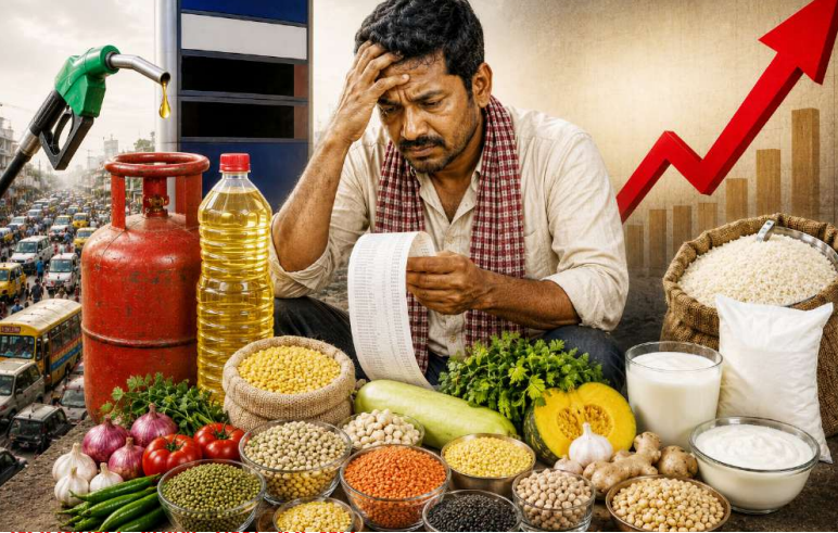
హైదరాబాద్ సుఖలే మాధ సులకలం..

రాజీయే రోజుల్లో ఇంధన ధరల పెంపు కేవలం వాహనదారులకే పరిమితం కాకుండా, సామాన్యుడి జీవితాన్ని అడుగడుగునా దెబ్బతీసే ప్రమాదం ఉంది. డిజిల్ ధర పెరిగితే రవాణా ఖర్చులు విపరీతంగా పెరిగి, నిత్యావసర వస్తువులైన బియ్యం, పప్పులు, పాలు, కూరగాయల ధరలు అకాశాన్ని తాకుతాయి. ఇది మధ్యతరగతి కుటుంబాల నెలవారీ బడ్జెట్ ను పూర్తిగా అస్తవ్యస్తం చేస్తుంది. రైతాంగం కూడా ట్రాక్టర్లు, పంపుసెట్ల వాడకంపై పెరిగే పెట్టుబడి భారంతో విలవిల లాడే అవకాశం ఉంది. చమురు సంస్థలు ఆర్థికంగా దెబ్బతింటే భవిష్యత్ క్షీణ ఎనర్జీ ప్రాజెక్టులకు నిధుల కొరత ఏర్పడి, దేశ ప్రగతి కుంటుపడుతుంది. జపాన్, బ్రిటన్ వంటి దేశాలు ఇప్పటికే భారీగా ధరలు పెంచగా, భారత్ కూడా అదే బాటలో నడవక తప్పని స్థితి కనిపిస్తోంది. ప్రజలు ఇప్పుడే పొదుపు బాట పట్టి, రాజీయే ధరల సునామీని తట్టుకునేందుకు సిద్ధం కావాలి ఉంది.