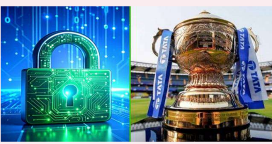
వేద న్యూస్ డెస్క్: