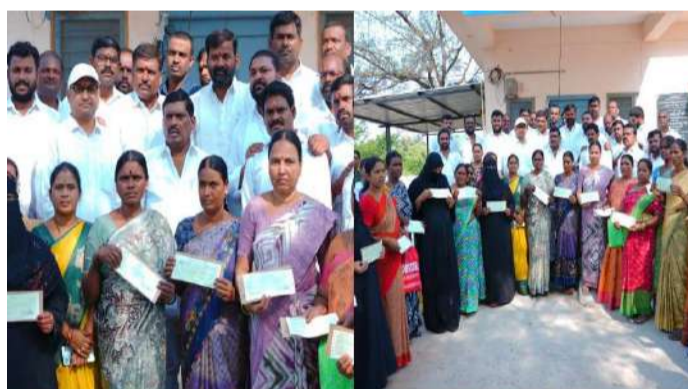
వేద న్యూస్ సంగారెడ్డి :

పట్టానెరు నియోజకవర్గం జిన్నారం మండల పరిధిలోని వివిధ గ్రామాలకు చెందిన 39 మంది లబ్ధిదారులకు కళ్యాణలక్ష్మి, షాదీ ముబారక్ పథకాల కింద మంజూరైన రూ.39 లక్షల విలువైన చెక్కులను పట్టానెరు ఎమ్మెల్యే గూడెం ముహిమ్మిన్ రెడ్డి బుధవారం పంపిణీ చేశారు. జిన్నారం తహసీల్దార్ కార్యాలయంలో ఏర్పాటు చేసిన సమావేశంలో ఈ కార్యక్రమం జరిగింది. ఈ సందర్భంగా ఎమ్మెల్యే మాట్లాడుతూ అర్హులైన ప్రతి ఒక్కరికీ ప్రభుత్వ సంక్షేమ పథకాలు పూర్తి పారదర్శకతతో అందిస్తున్నామని తెలిపారు. పేద కుటుంబాల ఆర్థిక భారం తగ్గించేందుకు ప్రభుత్వం కళ్యాణలక్ష్మి, షాదీ ముబారక్ వంటి పథకాలను సమర్థవంతంగా అమలు చేస్తోందన్నారు. ఈ పథకాలు వేలాది