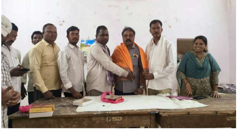
వేద న్యూస్, కారేపల్లి: