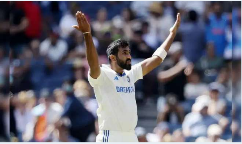
వేద న్యూస్ డెస్క్: