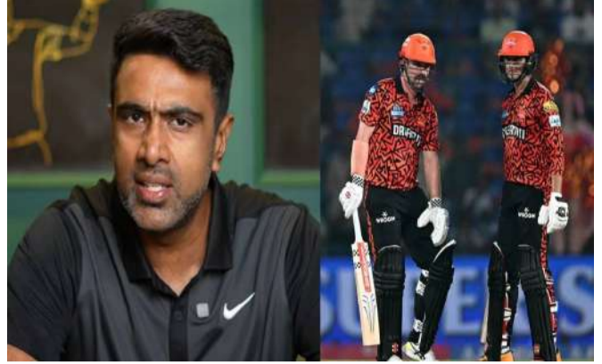
వేద న్యూస్ డెస్క్: