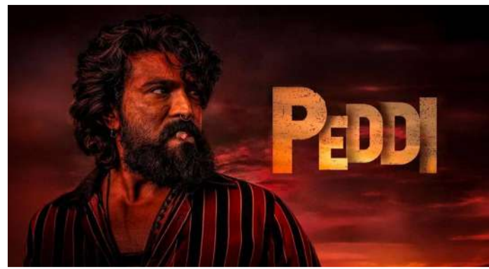
వేద న్యూస్ డెస్క్:

మెగా వవర్ స్టార్ రామ్ చరణ్ నటిస్తున్న భారీ చిత్రం 'పెద్ది'పై అభిమానుల్లో రోజురోజుకూ అంచనాలు పెరుగుతున్నాయి. ఇప్పటికే విడుదలైన ప్రచార చిత్రాలు, పోస్టర్లు, పాటలతో భారీ హైప్ తెచ్చుకున్న ఈ సినిమా ఇప్పుడు సంగీత వేడుకతో మరోసారి వార్తల్లో నిలిచింది. చిత్రబృందం మే 23న మధ్యప్రదేశ్లోని భోపాల్ నగరంలో గ్రాండ్ మ్యూజికల్ ఈవెంట్ నిర్వహించేందుకు సన్నాహాలు చేస్తోంది. ఈ ప్రత్యేక సంగీత కార్యక్రమంలో ఆస్కార్ అవార్డు గ్రహీత ఏ ఆర్ రెహమాన్ ప్రత్యక్ష ప్రదర్శన ఇవ్వనున్నట్లు సమాచారం. తన అద్భుతమైన సంగీతంతో ప్రపంచవ్యాప్తంగా అభిమానులను సంపాదించుకున్న రెహమాన్, 'పెద్ది' చిత్రంలోని పాటలను లైవ్లో ఆలపించనున్నారని తెలుస్తోంది. దీంతో ఈ ఈవెంట్పై అభిమానుల్లో భారీ ఆసక్తి నెలకొంది. వేలాదిమంది సంగీత ప్రేమికులు, మెగా అభిమానులు ఈ వేడుకకు హాజరయ్యే అవకాశముందని సినీ వర్గాలు వెలుతున్నాయి. 'పెద్ది' చిత్రాన్ని భారీ స్థాయిలో ప్రపంచవ్యాప్తంగా జూన్ 4న విడుదల చేయనున్నట్లు చిత్రబృందం ఇప్పటికే ప్రకటించింది. ఈ సినిమాలో రామ్ చరణ్ పూర్తిగా కొత్త లుక్లో కనిపించనున్నారని సమాచారం. మాస్, యాక్షన్, భావోద్వేగాల మేళవింపుతో తెరకెక్కుతున్న ఏ ఆర్ రెహమాన్ అందించిన స్వరాలు ప్రేక్షకులను ఆకట్టుకుంటుండగా, కొన్ని పాటలు యువతలో ప్రత్యేక ఆదరణ పొందుతున్నాయి. సినిమా విడుదలకు ముందే సంగీతం పెద్ద ఎత్తున చర్చనీయాంశంగా మారడంతో, 'పెద్ది'పై మరింత హైప్ పెరిగింది. సంగీతం, విజువల్స్, రామ్ చరణ్ నటన కలయికతో ఈ చిత్రం ఈ ఏడాది అత్యంత ఆసక్తిగా ఎదురుచూస్తున్న సినిమాల్లో ఒకటిగా నిలిచింది. భోపాల్లో జరగనున్న సంగీత వేడుకతో సినిమా ప్రచారం మరింత ఊపందుకోనుంది