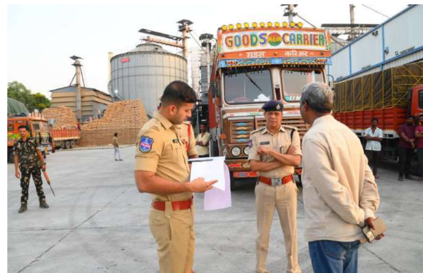
- జిల్లా ఎస్పీ శరత్ చంద్ర పవార్