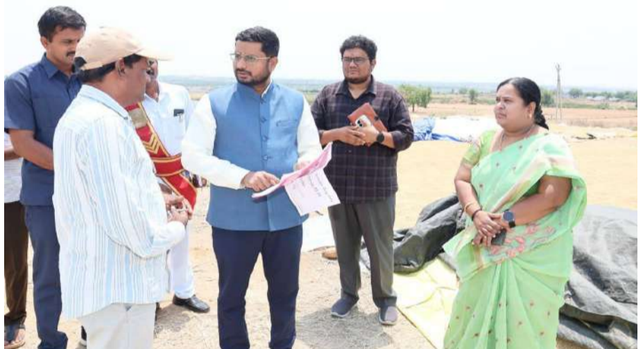
వేద న్యూస్ వికారాబాద్ :