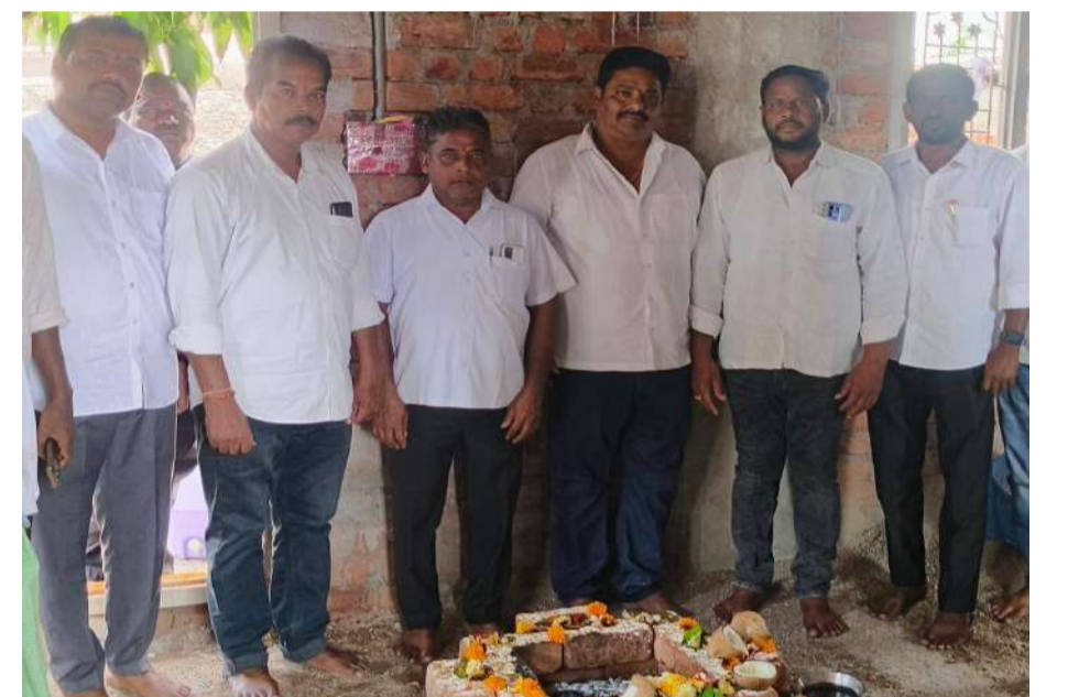
వేద న్యూస్, గొల్లపల్లి: