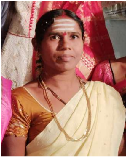
వేద న్యూస్, పాపన్నపేట:

- అల్మారాకు విద్యుత్ సరఫరా కావడంతో విషాదం