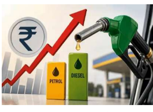
వేద న్యూస్ డెన్యూ :