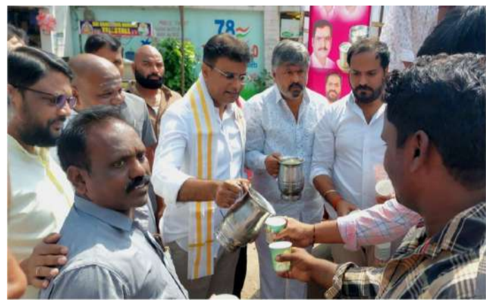
వేద న్యూస్ హైదరాబాద్ :