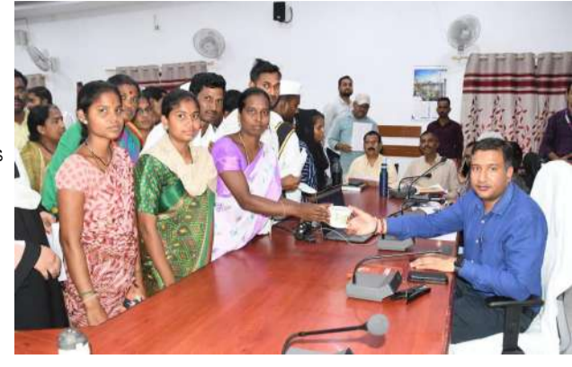
వేద న్యూస్ అదిలాబాద్ :

జిల్లా ప్రజల సమస్యలను నేరుగా తెలుసుకుని పరిష్కరించేందుకు సోమవారం కలెక్టరేట్ సమావేశ మందిరంలో ప్రజావాణి కార్యక్రమాన్ని నిర్వహించారు. ఈ కార్యక్రమంలో జిల్లా కలెక్టర్ రాజర్షిషా ప్రజల నుంచి అర్జీలు స్వీకరించారు. జిల్లా నలుమూలల నుంచి వచ్చిన ప్రజలు తమ సమస్యలను కలెక్టర్ దృష్టికి తీసుకువచ్చారు. భూ వివాదాలు, సంక్షేమ పథకాలు, పింఛన్లు, తాగునీరు, ఉపాధి, రవాదారులు, విద్యుత్, రెవెన్యూ సంబంధిత అంశాలపై ప్రజలు వినతిపత్రాలు సమర్పించారు. ప్రతి అర్జీని జాగ్రత్తగా పరిశీలించిన కలెక్టర్ సంబంధిత శాఖల అధికారులతో చర్చించి సమస్యల పరిష్కారానికి చర్యలు తీసుకోవాలని సూచించారు. ప్రజలు ఇబ్బందులు పడకుండా అధికారులు వేగంగా స్పందించాలని ఆదేశించారు. ప్రజావాణి కార్యక్రమం ద్వారా ప్రజలకు ప్రభుత్వ సేవలు మరింత చేరువ అవుతున్నాయని అధికారులు తెలిపారు. కార్యాలయాల చుట్టూ తిరగకుండా ఒకే వేదికపై సమస్యలు పరిష్కరించే విధంగా ప్రభుత్వం ప్రత్యేక చర్యలు చేపడుతోందని పేర్కొన్నారు. అందిన ప్రతి అర్జీని గడువులోగా పరిష్కరించేందుకు అధికారులు బాధ్యతగా పనిచేయాలని కలెక్టర్ సూచించారు.