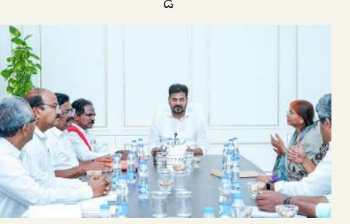
వేద న్యూస్, హైదరాబాద్