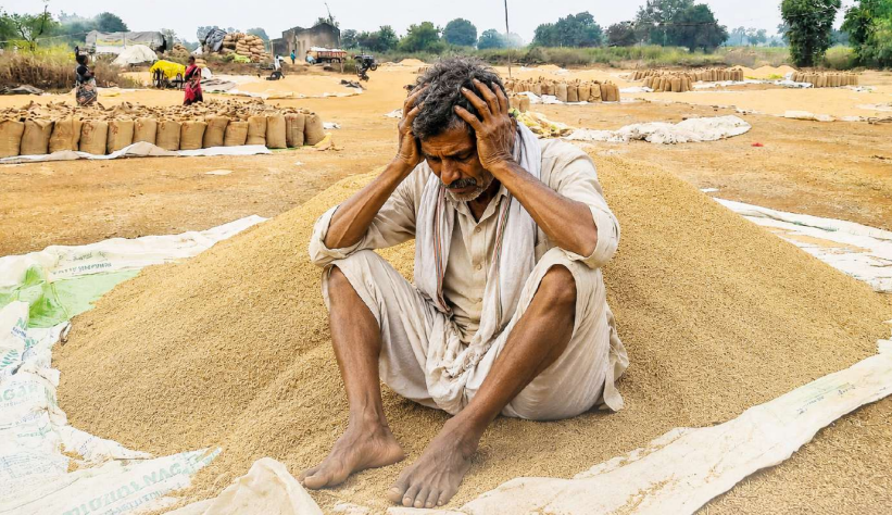
తీవ్ర జాప్యం జరుగుతోంది. నెల రోజులుగా మార్కెట్లు, రహదారులు, గోదాముల ముందు అన్నదాతలు పడిగాపులు పడుతున్నారు.

రాష్ట్రంలోని వ్యవసాయ మార్కెట్లు, రైస్ మిల్లులు, ఐకేపీ కొనుగోలు కేంద్రాలు ఎక్కడ చూసినా కిలోమీటర్ల మేర ట్రాక్టర్లు, ఎడ్ల బండ్లతో రైతులు బారులు తీరి కనిపిస్తున్నారు. కొనుగోలు కేంద్రాల్లో కనీసం గన్నీ బ్యాగులు అందుబాటులో లేవు, లోడింగ్ చేయడానికి హమాళీలు రాకుండా, పంటను మిల్లులకు తరలించడానికి లారీలు రావడం లేదు. దీంతో కాంటాలు ఘోరంగా నిలిచిపోయి కొనుగోళ్లలో