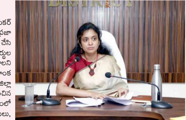
వేద న్యూస్ నారాయణపేట :