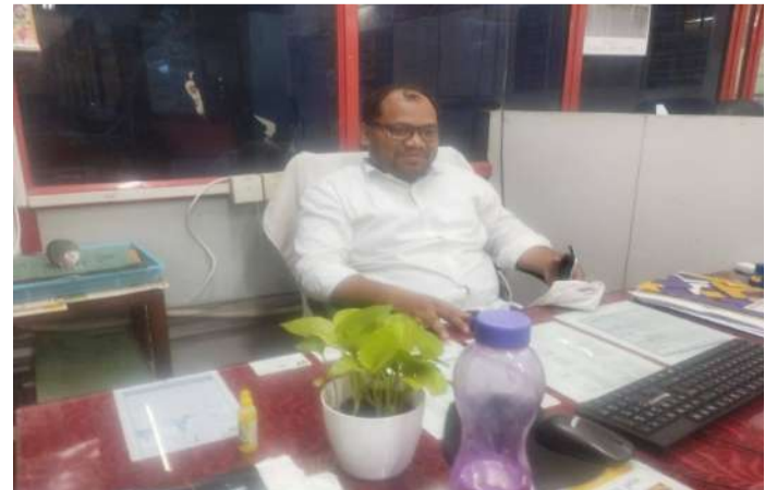
వేద న్యూస్, మహబూబాబాద్:

ప్రభుత్వ సంక్షేమ పథకాలు, బ్యాంకింగ్ సేవలు, పింఛన్లు, పాస్ పోర్టు, పాన్ కార్డు, రేషన్ కార్డు, ఆరోగ్య సేవలు తదితర అవసరాలకు ఆధార్ కీలక గుర్తింపు పత్రంగా మారిన అధికారులు తెలిపారు. ముఖ్యంగా 5 నుంచి