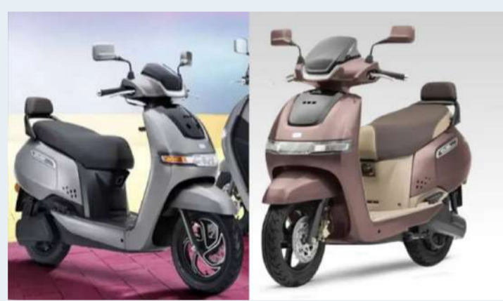
వేద న్యూస్ డెన్యూ :

దేశంలో పెట్రోల్, డీజిల్ ధరలు వరుసగా పెరుగుతున్న నేపథ్యంలో ఎలక్ట్రిక్ వాహనాల వైపు ప్రజలు ఎక్కువగా మొగ్గు చూపుతున్నారు. ముఖ్యంగా నగరాల్లో రోజువారీ ప్రయాణాలకు అనువుగా ఉండే ఎలక్ట్రిక్ స్కూటర్లకు డిమాండ్ భారీగా పెరిగింది. ఈ క్రమంలో టీవీఎస్ సంస్థ తయారు చేసిన 'ఐక్యూబ్' ఎలక్ట్రిక్ స్కూటర్ మార్కెట్లో మంచి ఆదరణ పొందుతోంది. ఆకర్షణీయమైన డిజైన్, అధునాతన సాంకేతిక ఫీచర్లు, మంచి రేంజ్ కారణంగా వినియోగదారులను ఆకట్టుకుంటోంది. టీవీఎస్ సంస్థ ఐక్యూబ్, ఐక్యూబ్ ఎస్, ఐక్యూబ్ ఎస్ టీ పేర్లతో మూడు రకాల మోడళ్లను అందుబాటులోకి తీసుకొచ్చింది. వీటిలో బేసిక్ మోడల్ తక్కువ ధరలో లభిస్తుండగా, ఎస్ టీ మోడల్ అత్యధునిక ఫీచర్లతో ప్రీమియం వాహనంగా నిలుస్తోంది. ఐక్యూబ్ స్కూటర్లలో 2.2 కిలోవాట్, 3.1 కిలోవాట్, 3.5 కిలోవాట్, 5.3 కిలోవాట్ బ్యాటరీ ఎంపికలు ఉన్నాయి. 2.2 కిలోవాట్ బ్యాటరీ కలిగిన స్కూటర్ ఒక్కసారి పూర్తి ఛార్జ్ చేస్తే సుమారు 94 కిలోమీటర్లు ప్రయాణిస్తుంది. 3.1 కిలోవాట్ మోడల్ 123 కిలోమీటర్ల వరకు, 3.5 కిలోవాట్ మోడల్ 145 కిలోమీటర్ల వరకు ప్రయాణించే సామర్థ్యాన్ని కలిగి ఉంది. టాప్ మోడల్ అయిన ఐక్యూబ్ ఎస్ టీ 5.3 కిలోవాట్ బ్యాటరీతో ఏకంగా 212 కిలోమీటర్ల రేంజ్ ఇస్తుందని సంస్థ వెల్లడించింది. ఈ స్కూటర్లలో ఎల్ఈడి లైటింగ్, ఎకో మోడ్, పవర్ మోడ్,