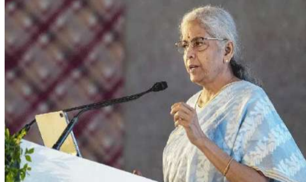
వేద న్యూస్ డెన్యూ :