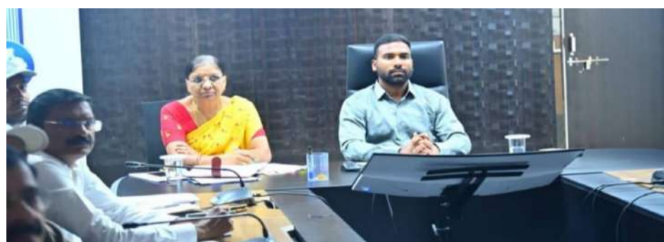
వేద న్యూస్, జగిత్యాల: