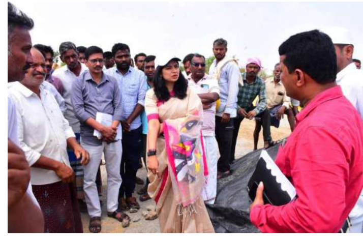
వేద న్యూస్, తంగళ్లపల్లి: