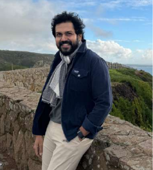
కార్తీతో మ్యాడ్ డైరెక్టర్ మూవీ