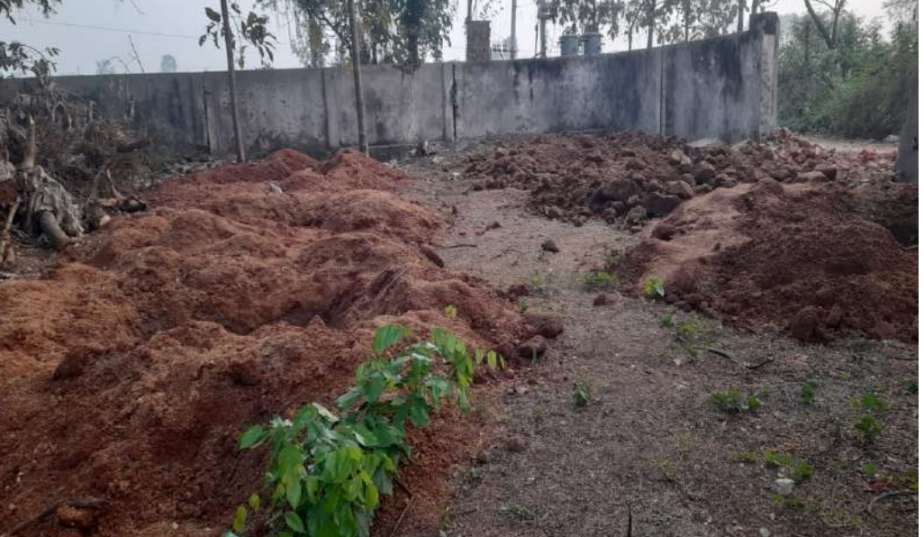
వ్యవహారిస్తున్నారని గ్రామస్థులు ఆరోపిస్తున్నారు. ప్రహారీ గోడ తొలగిపోవడంతో విద్యార్థుల భద్రత ప్రమాదంలో పడిందని ఆందోళన వ్యక్తం చేస్తున్నారు. పాఠశాలను అభివృద్ధి చేయాల్సింది పోయి, ప్రభుత్వ ఆస్తులను కూల్చివేయడం వెనుక అసలు కారణమేంటి?" అంటూ