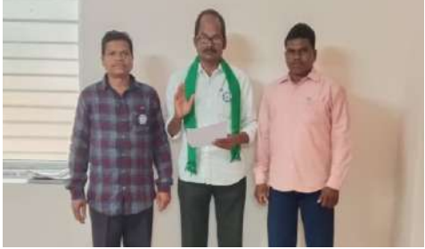
వైర్లెస్ తెల్లం శేఖర్ ఆరోపించారు. ఇప్పటికైనా భక్తుల మనోభాలను దృష్టిలో పెట్టుకొని తక్షణమే పోలవరం జిల్లా అధికారులు, పోలవరం జాతీయ ప్రాజెక్టు ఇరిగేషన్

నేటి పట్టు: మండలం,పూడి పల్లి గ్రామ పంచాయతీ పరిధిలోని గోండు గ్రామంలో స్వయంభూగా వెలసిన మాతృశ్రీ గండి పోశమ్మ తల్లి ఆలయం పురాతనమైనది. ఈ ఆలయానికి ఆంధ్రప్రదేశ్ రాష్ట్రంలోని నలుమూలల నుండి దర్శించుకోవటమే కాకుండా వివిధ రాష్ట్రాల్లో ఉన్న దైవ భక్తులు కూడా దర్శనానికి వస్తున్నారు. పోలవరం జాతీయ ప్రాజెక్టు ఇరిగేషన్ శాఖ అధికారులు రోడ్డుకు అడ్డంగా తవ్వేయటం లేదా మట్టి గుట్టలు వేయటం చేస్తున్నారంటే దైవభక్తుల మనోభాలను కించపరుస్తున్న సాంకేతికం సృష్టంగా కనిపిస్తుందని ఏపీ ఆడివాసీ జేపీసీ రాష్ట్ర వైస్