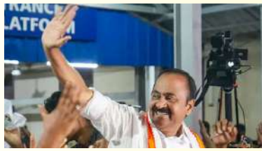
సీఎం పేరును ప్రకటించేందుకు కాంగ్రెస్ హైకమాండ్ రంగంలోకి దిగాల్సి వచ్చింది.

విజయం నమోదు చేసిన విషయం తెలిసింది. అయితే ముఖ్యమంత్రి ఎన్నిక విషయంలో ఉత్పంఠ నెలకొన్నది. సీఎం పదవి కోసం సతీశన్ తో పాటు కేసీ వేణుగోపాల్, రమేష్ చెన్నితల తీవ్రంగా పోటీపడ్డారు. ప్రభుత్వ ఏర్పాటు కోసం కాంగ్రెస్ కు క్షియర్ మెజారిటీ ఉన్నా.. సీఎం ఎంపిక విషయంలో మాత్రం తీవ్ర జాప్యం జరిగింది.