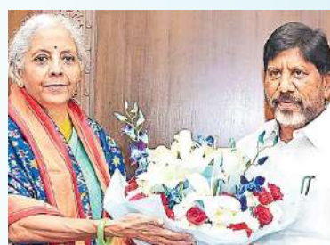
విజ్ఞప్తులపై స్పందించిన కిషన్ రెడ్డి.. సమస్యల పరిష్కారానికి త్వరలోనే కేంద్ర, రాష్ట్ర, సింగరేణి అధికారులతో సంయుక్త సమావేశం ఏర్పాటు చేస్తామని హామీ ఇచ్చారు.

సిద్ధంగా ఉందని కేంద్ర మంత్రి కిషన్ రెడ్డికి తెలిపారు. ఢిల్లీలో బుధవారం నిర్మలా సీతారామన్, కిషన్ రెడ్డిని ఆయన వేర్వేరుగా కలిసి వినతిపత్రాలు సమర్పించారు. తొలుత నిర్మలా సీతారామన్ కలిసిన భట్టి.. పలు అంశాలను ప్రస్తావించారు. తెలంగాణలో 105 యంగ్ ఇండియా ఇంటిగ్రేటెడ్ స్కూళ్ల నిర్మాణానికి రూ.21,000 కోట్లు, డిగ్రీ, జూనియర్, సాంకేతిక కళాశాలల్లో మౌలిక పనుల కోసం రూ.9,000 కోట్లను వెచ్చిస్తున్నామని వివరించారు. ఈ