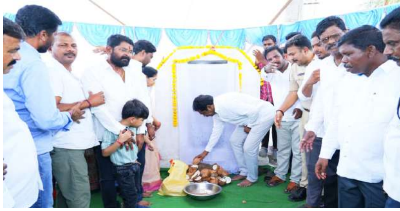
యితే స్థానికులకు మురుగునీటి సమస్యల నుంచి ఉపశమనం కలుగుతుందని, వర్షాకాల ఇబ్బందులు తీరుతాయని తెలిపారు. అభివృద్ధి పనుల నాణ్యత విషయంలో అధికారులు, కాంట్రాక్టర్లు రాజీ పడకుండా సమయానికి పూర్తి చేయాలని ఆదేశించారు. డ్రైనేజీ, రోడ్లు, తాగునీరు, వీధి దీపాల సమస్యలను దశలవారీగా పరిష్కరిస్తున్నామని అన్నారు. ఈ కార్యక్రమంలో మాజీ ప్రజాప్రతినిధులు, కాంగ్రెస్ నాయకులు, యూత్ కాంగ్రెస్ కార్యకర్తలు, మహిళలు, అధికారులు పాల్గొన్నారు.

ప్రజలకు మెరుగైన మౌలిక వసతుల కల్పనకు ప్రభుత్వం కట్టుబడి ఉందని వర్ధన్నపేట ఎమ్మెల్యే కేఆర్ నాగరాజు అన్నారు. బుధవారం 14వ డివిజన్ పరిధిలో అభివృద్ధి పనులకు ఆయన శంకుస్థాపన చేశారు. బాలాజీ నగర్ జంక్షన్ వద్ద బాబు జగ్జీవన్ రామ్ బొమ్మ నుండి లేబర్ కాలనీ 100 ఫిట్ల రోడ్డు వరకు రూ.6 కోట్లతో అండర్ గ్రౌండ్ డ్రైనేజీ ఫైపుల నిర్మాణ పనులకు శంకుస్థాపన చేశారు. అనంతరం శ్రీనివాస కాలనీలో రూ.50 లక్షలతో సీసీ రోడ్, డ్రైనేజీల నిర్మాణ పనులను ప్రారంభించారు. ఈ సందర్భంగా ఎమ్మెల్యే మాట్లాడుతూ.. పెరుగుతున్న జనాభాకు అనుగుణంగా పారిశుధ్య వ్యవస్థను బలోపేతం చేస్తున్నామన్నారు. యూజీడీ పనులు పూర్తయితే స్థానికులకు మురుగునీటి సమస్యల నుంచి ఉపశమనం కలుగుతుందని, వర్షాకాల ఇబ్బందులు తీరుతాయని తెలిపారు. అభివృద్ధి పనుల నాణ్యత విషయంలో అధికారులు, కాంట్రాక్టర్లు రాజీ పడకుండా సమయానికి పూర్తి చేయాలని ఆదేశించారు. డ్రైనేజీ, రోడ్లు, తాగునీరు, వీధి దీపాల సమస్యలను దశలవారీగా పరిష్కరిస్తున్నామని అన్నారు. ఈ కార్యక్రమంలో మాజీ ప్రజాప్రతినిధులు, కాంగ్రెస్ నాయకులు, యూత్ కాంగ్రెస్ కార్యకర్తలు, మహిళలు, అధికారులు పాల్గొన్నారు.