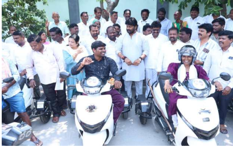
లు అందించే దిశగా నిరంతరం కృషి కొనసాగుతుందని పేర్కొన్నారు. వాహనాలు అందుకున్న లబ్ధిదారులు ఎమ్మెల్యేకు కృతజ్ఞతలు తెలిపారు. ఈ కార్యక్రమంలో మేయర్, డిప్యూటీ మేయర్, కార్పొరేటర్లు, ప్రజాప్రతినిధులు, ముఖ్య నాయకులు, కార్యకర్తలు మరియు ఇతరులు పాల్గొన్నారు.