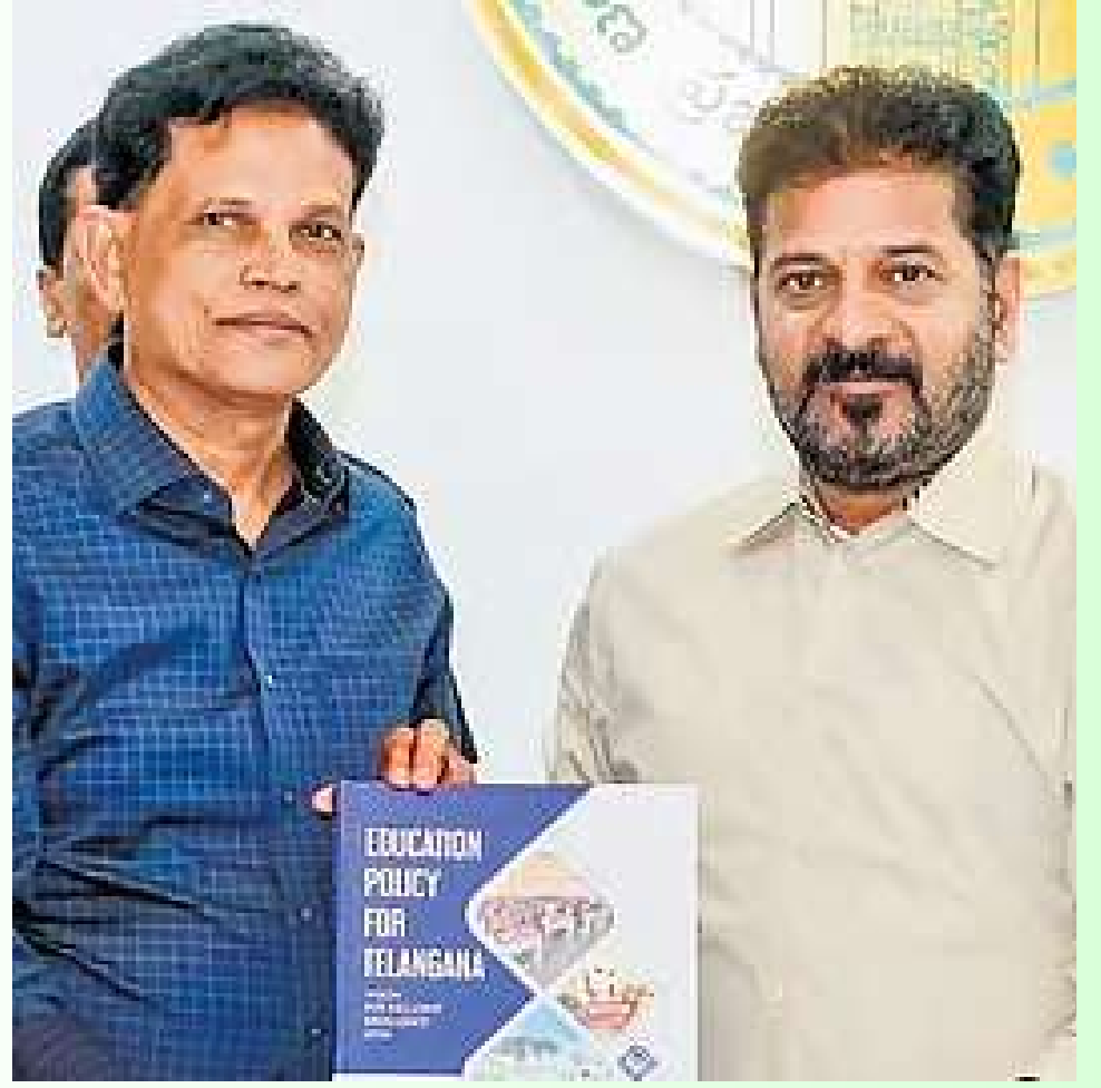
ఉపాధ్యాయ లోకం నుంచి వచ్చిన తప్పుకోవాలని నిర్ణయించుకున్నట్లు తీవ్ర వ్యతిరేకత, అంతర్గత ఒత్తిళ్ల సచివాలయ వర్గాల ద్వారా వల్లే ఆయన ఈ పదవి నుంచి తెలుస్తోంది.