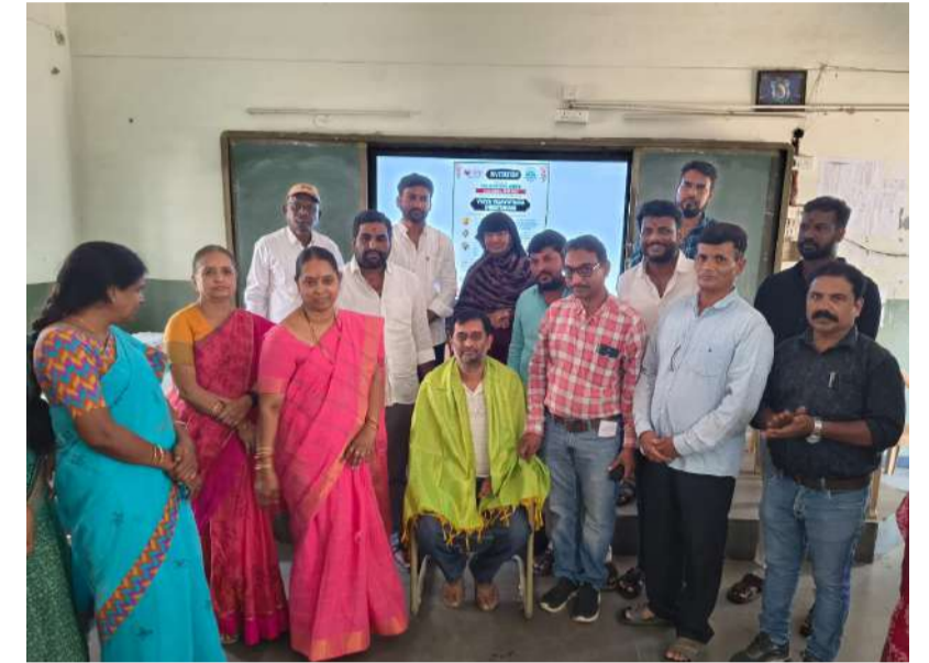
మీ ఇచ్చారు. ఈ కార్యక్రమంలో గ్రామ పంచాయతీ పాలకవర్గ సభ్యులు, ఉపాధ్యాయులు, విద్యార్థులు, తదితరులు పాల్గొన్నారు..