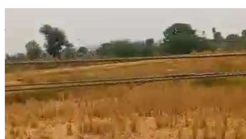
దించి వెంటనే వైర్లను క్లియర్ చేయగలరని రైతులు కోరుకుంటున్నారు.

జనోదయ : ఎల్లారెడ్డిపేట ఎల్లారెడ్డిపేట నారాయణపురం గ్రామంలో. మండలంలో ప్రమాదకరంగా మారిన నారాయణపురం త్రిపిస్ వైర్లు లూజు కలెక్షన్లతో కిందికి వేలాడుతున్నాయి ప్రమాదాలు జరిగిన తర్వాత బాధపడితే లాభం లేదు వెంటనే సంబంధించిన అధికారులు ఏవి వెంటనే స్పందించి తగిన చర్యలు తీసుకోగలరు ప్రమాదాలు జరిగే అవకాశాలు ఉన్నాయి గొర్రెలు మేకలు బర్లు నేతలకు పోయే ప్రమాదం ఉంది ప్రమాదవశాత్తుగా చనిపోతే లక్షల నష్టం జరుగుతుంది కావున వెంటనే ఎలక్ట్రికల్ లైన్మెన్లు స్పం