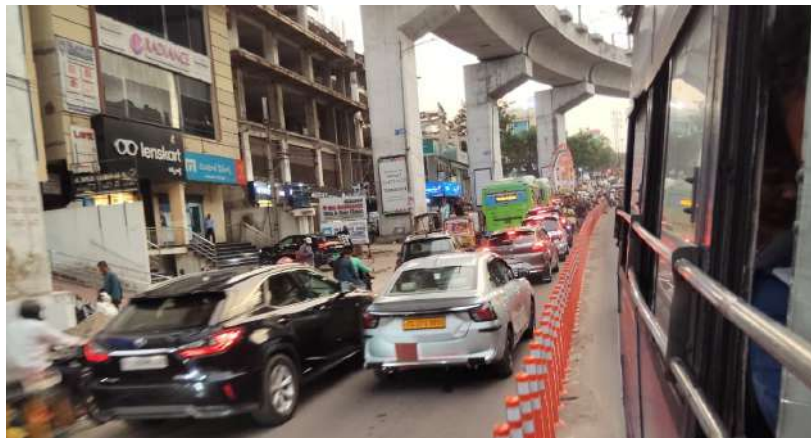
జనోదయ : జూజీహిల్స్

ఐటీ సెక్టార్, హైటెక్ సిటీకి పోయే దారి, ప్రముఖ హాస్పిటల్ ఆఫీలో కి పోయే దారి, ప్రముఖ స్టూడియో లు ఉన్న ప్రాంతానికి వెళ్ళే దారి అయిన జూజీహిల్స్ నియోజకవర్గం శ్రీ కృష్ణ నగర్ మెయిన్ రోడ్ లో ప్రతిరోజూ సాయంత్రం నిత్యం ట్రాఫిక్ జామ్. ట్రాఫిక్ అధికారులు ఈ సమస్యను స్వయంగా చూసి సమస్యను పరిష్కరించాల్సిందిగా శ్రీ కృష్ణ నగర్ బస్ స్టాప్ వాసులు కోరుతున్నారు.