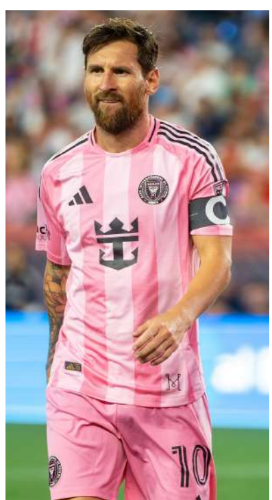
16వ అల్బీరియాతో అర్రెంటీనా తలపడనుంది.

ఆడుతున్న లియోన్ మెస్సీ ఆదివారం మ్యాచ్ ఆడుతూ మైదానంలో గాయపడ్డాడు. ఎడమ కాచి నొప్పి కారణంగా అతడు ఇలా వచ్చి అలా బయటకు వెళ్ళాడు. 'మేజర్ లీగ్ సాకర్ లో ఫిట్ నెస్స్ లో గాయపడ్డాడు. ఎడమ తొడ కండరాల నొప్పితో విలవిలలాడుతూ అతడు మైదానంలో కూలబడ్డాడు. వైద్య పరీక్షల అనంతరం అతడు కండరాల అలసటతో బాధ పడుతున్నాడని తెలిసింది. తొడ కండరాల గాయం నుంచి కోలుకోవడం అనేది వైద్యపరమైన అంశాలు, శారీరక స్పందనపై ఆధారపడి ఉంది. ఈ గాయం నుంచి కోలుకునేందుకు ఒక్కోసారి కొన్ని రోజుల్లోనే కొన్ని సార్లు.. వారాలు పడుతుంది' అని ఇంటర్ మియామ్ క్లబ్ ఓ ప్రకటనలో తెలిపింది. జూన్ 11 నుంచి ఫిఫా ప్రపంచకప్ మొదలవుతుంది. జూన్