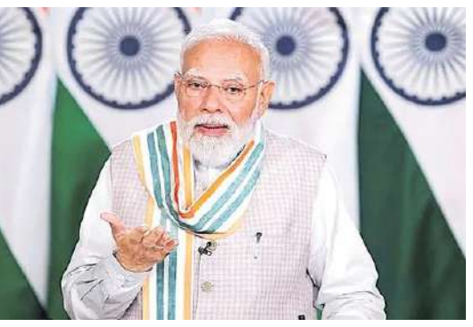
సవ్యాలను తగ్గించుకోవచ్చని.. పునరుత్పాదక ఇంధనాన్ని ఉత్పత్తి చేయవచ్చని ఆయన అభిప్రాయపడ్డారు.

దుకు రాష్ట్రాలను ప్రోత్సహిస్తున్నామన్నారు. బుధవారం ఆయన ఆధ్వర్యంలో 51వ ప్రగతి సమావేశం జరిగింది. ఇందులో 9 రాష్ట్రాల పరిధిలో చేపట్టిన రూ.30 వేల కోట్ల విలువైన రైల్వే, విద్యుత్, రోడ్ల ప్రాజెక్టులపై సమీక్ష జరిపారు. ప్రాజెక్టుల అమలులో ఆలస్యం జరిగితే ఖర్చులు పెరగడమే గాక.. ఖరీదులకు సకాలంలో అత్యవసర సేవలు అందకుండా పోతాయని ఈ సందర్భంగా ఆయన తెలిపారు. కాలువల వ్యవస్థను సరికొత్తగా వినియోగించుకోవాలన్నారు. కాలువల వెంబడి, వాటిపైన సోలార్ ప్యానెళ్లను ఏర్పాటు చేయాలని.. చారిత్ర ఇంధన ఉత్పత్తికి వాటిని ఉపయోగించుకోవాలని సూచించారు. దీనివల్ల భూవినియోగాన్ని, నీటి ఆవిరి