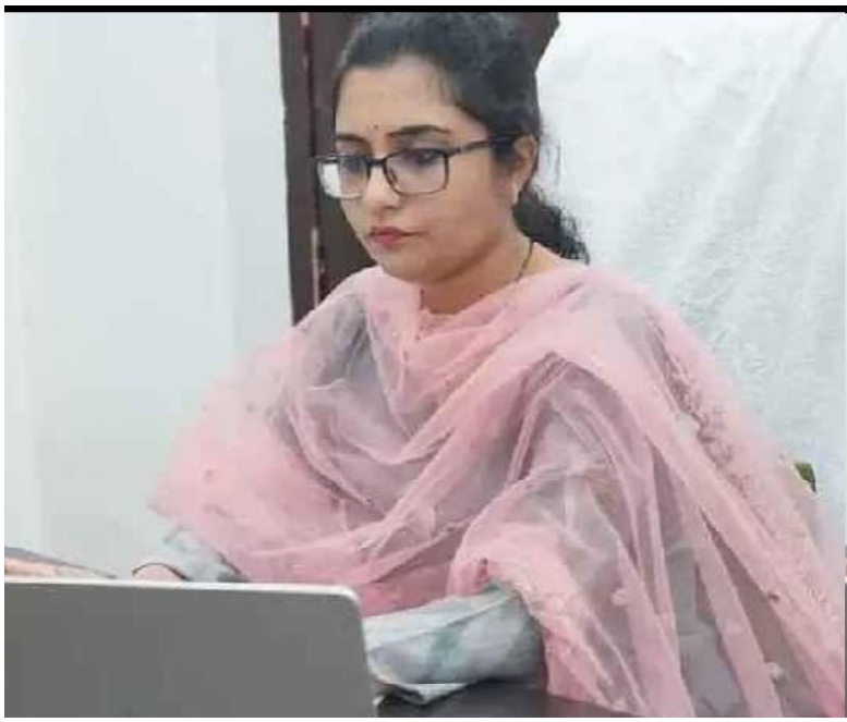
క్రైమ్ కౌంటర్ : నరసరావుపేట (ప్రతినిధి : జి.ఎం.కె.)-పల్నాడు జిల్లాలో రైతులకు రెవెన్యూ సేవలు వేగంగా,పారదర్శకంగా అందేలా చర్యలు తీసుకోవాలని పల్నాడు జిల్లా ఇంచార్జ్ కలెక్టర్ సంజనా సిన్హా అధికారులను ఆదేశించారు.

రైతులకు వెంటనే పాసు పుస్తకాలు ఇవ్వండి: ఇంచార్జ్ కలెక్టర్ సంజనా సింహ.