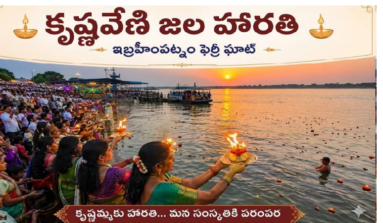
కృష్ణమ్మకు హారతి... మన సంస్కృతికి పరంపర

ఏపీ,విజయవాడ.మే 28(క్రైం కౌంటర్ బ్యూరో వీఫ్ సల్మాన్): విజయవాడ ఇండ్రక్టిలాడ్రి క్షేత్రంలోని శ్రీ దుర్గా మల్లేశ్వర స్వామివార్ల దేవస్థానం ఆధ్వర్యంలో ఇబ్రహీంపట్నం పవిత్ర సంగమం (ఫైల్ ఫూట్) వద్ద నిర్వహించే “కృష్ణవేణి నదీ నవహారతులు” కార్యక్రమాన్ని పునఃప్రారంభించేందుకు దేవస్థానం సర్వసన్నద్ధమవుతోంది. సనాతన హిందూ ధర్మ ప్రచారం మరియు టెంపుల్ టూరిజం అభివృద్ధిలో భాగంగా రాష్ట్ర ప్రభుత్వ ఆదేశాల మేరకు ఈ కార్యక్రమాన్ని తిరిగి ప్రారంభించనున్నారు.వచ్చే నెల 05-06-2026 తేదీ నుంచి నవహారతుల కార్యక్రమాన్ని అత్యంత వైభవంగా, నిరంతరాయంగా నిర్వహించేందుకు దేవస్థానం తగు చర్యలు చేపట్టింది. పవిత్ర సంగమం వద్ద నవహారతులను శాస్త్రోక్తంగా, భక్తిశ్రద్ధలతో నిర్వహించేందుకు అవసరమైన సూచనలు, మార్గదర్శకాలను లిఖితపూర్వకంగా సమర్పించవలసిందిగా ఆలయ స్థానాచార్యులు మరియు వైదిక కమిటీ సభ్యులకు దేవస్థానం ఈవో శీనా నాయక్ ఆదేశాలు జారీ చేశారు. క్షేత్రస్థాయిలో సమగ్ర పరిశీలననవహారతుల నిర్వహణకు అవసరమైన పనులు, భద్రతా ఏర్పాట్లు, విద్యుత్ అలంకరణలు, భక్తుల సౌకర్యాలు తదితర అంశాలపై క్షేత్రస్థాయిలో సమగ్ర పరిశీలన చేపట్టాలని ఈవో శీనా నాయక్ సంబంధిత అధికారులను ఆదేశించారు.దేవస్థానం ఎగ్జిక్యూటివ్ ఇంజనీర్లు, సహాయ కమిషనర్, పౌర సంబంధాల అధికారి, వైదిక కమిటీ సభ్యులతో కలిసి ఉమ్మడిగా పరిశీలన నిర్వహించి, అన్ని ఏర్పాట్లపై పూర్తి స్థాయి సమగ్ర నివేదికను 02-06-2026 లోపు సమర్పించవలసిందిగా స్పష్టమైన గడువు విధించారు. పవిత్ర కృష్ణమ్మ తల్లికి అర్పించే ఈ నవహారతుల కార్యక్రమం భక్తులను, పర్యాటకులను విశేషంగా ఆకట్టుకునేలా ఎటువంటి లోటుపాట్లు లేకుండా అత్యంత ప్రతిష్టాత్మకంగా నిర్వహించేందుకు చర్యలు చేపట్టాలని ఈవో అధికారులకు సూచించారు.