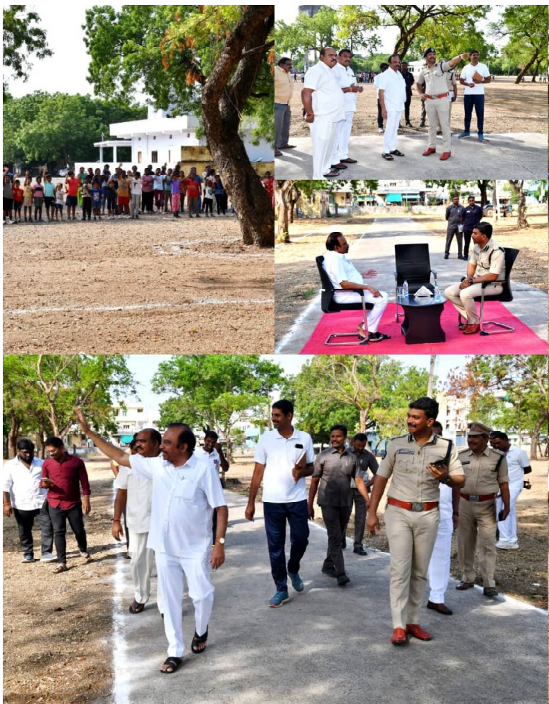
క్రైం కౌంటర్ సూప్స్..... ప్రకాశం జిల్లా.... పోలీస్ సిబ్బంది సంక్షేమం కోసం ఆధునిక వసతుల ఏర్పాటుకు ప్రణాళికలు, పోలీసులు ఏర్పాటు చేసిన సమూర్ క్యాంప్ లో ఆలూడుతున్న చిన్నారలను చూసి ఆనందం వ్యక్తం చేసిన ఒంగోలు పార్లమెంటు సభ్యులు శ్రీ మాగుంట శ్రీనివాసరెడ్డి ఎంపీ, ని చూసిన వెంటనే హాయ్ అంకుల్ అంటూ కేరింతలు కొట్టిన చిన్నారలు