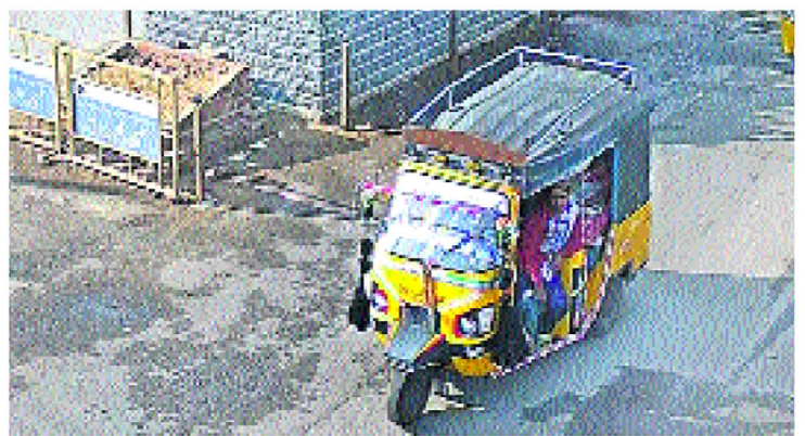
ఈనెల 1న మహిళను తీసుకెళ్లిన ఆటో