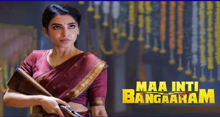
MAA INTI BANGARAM

ప్రముఖ నటి సమంత సినిమా 'మా ఇంటి బంగారం' విడుదల వాయిదా పడింది. ఈ నెల 15న రిలీజ్ చేయాలనుకున్న ఈ చిత్రాన్ని.. జూన్ 19న ప్రేక్షకుల ముందుకు తీసుకురానున్నట్లు మేకర్స్ ప్రకటించారు. ఐపీఎల్ కీలక దశకు చేరుకుంటున్న నేపథ్యంలో పోస్ట్పోస్ట్ చేశారు. 'ఓ బేబీ' తర్వాత సమంత ప్రధాన పాత్రలో దర్శకురాలు నందినిరెడ్డి తెరకెక్కించిన చిత్రమిది. బాలీవుడ్ నటుడు గుల్షన్ దేవయ్య మరో కీలక పాత్రధారి. క్రైమ్ డ్రైలర్ కథతో రూపొందిన ఈ చిత్రంలో సమంత.. మునుపెన్నడూ చూడని లుక్లో కనిపించనున్నారు. ఈ సినిమాలో అమె ఫైట్స్ కూడా చేయడం విశేషం. తన నిర్మాణ సంస్థ స్ట్రాలాలా మూవింగ్ పిక్చర్స్ పతాకంపై సమంత నిర్మించిన రెండో సినిమా ఇది. అమె భర్త, దర్శకుడు రాజ్ నిడిమోరు, హిమాంత్ కున్యూరి సహ నిర్మాతలు.