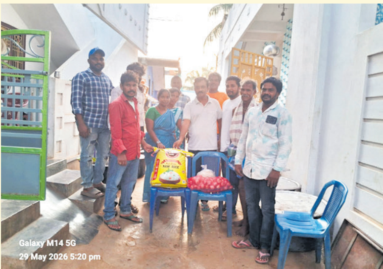
Galaxy M14 5G 29 May 2026 5:20 pm