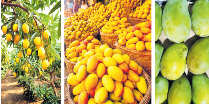
విశాఖలో మే 28 నుంచి 3వ మామిడి ఫలాల మేళా.....

ఫలాల్లో రారాజు మామిడి ఫలమే అని చెప్పాలి, పోషక విలువలు గల ఈ ఫలం వేసవిలో ఓ వరం. ప్రకృతి ప్రసాదించిన ఈ అమృతాన్ని మితంగా ఆస్వాదిస్తే ఆరోగ్యపరంగా లాభాలెన్నో. అయితే ఆ మామిడిని సాగు చేస్తున్న రైతులను మాత్రం కష్టాలు వెంటాడుతున్నాయి. నీటి ఎద్దడి, మంచు, గాలివానల వల్ల ప్రతీ సంవత్సరం దిగుబడి పడిపోతోంది. కాయ దిగుబడి తగ్గితే గిట్టు బాటు ధరలు పెరగాలి. కానీ, వ్యాపారులు ధరలను నియంత్రిస్తుండటంతో, నష్టాల భారం రైతులకు, అధిక ధరలు ప్రభావం