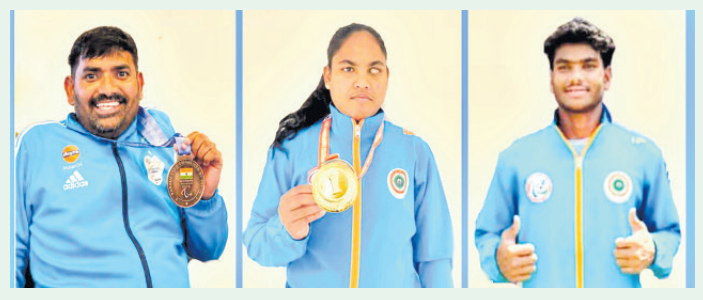
విజయనగరం, మే 29 (మనసులో మాట):