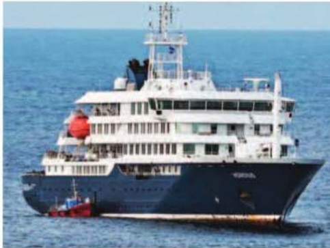
మాన్యులు లేకుండా.. కలిసి భోజం చేసే..