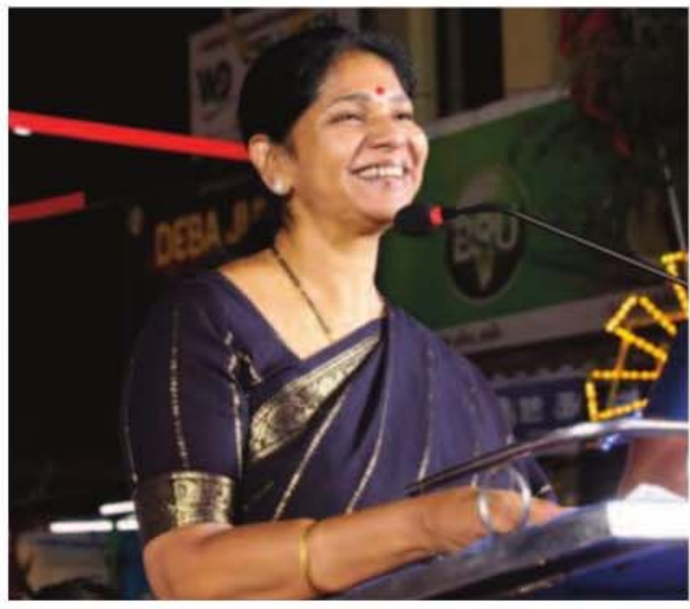
కలిసి పోటీచేసి ఓటమి చవిచూశారున్నారు. ప్రతి పార్టీకి తమకు ఏదైతే సరైనదని అనిపిస్తుందో అది చేసే హక్కు ఉంటుందన్నారు. ఇతరుల గురించి తాను చెప్పేది ఏమీ లేదని, తమ పోరాటం

చెన్నై మే 8 : తమిళనాడు అసెంబ్లీ ఎన్నికల్లో 108 సీట్లు సాధించినా.. మెజార్టీ లేకపోవడంతో టీవీకే పార్టీ ప్రభుత్వాన్ని ఏర్పాటు చేయలేకపోతోంది. దీన్ని డీఎంకే, అన్నాడిఎంకే పార్టీలు అవకాశంగా మలుచు కోవాలని చూస్తున్నాయి. ఇరు పార్టీల అగ్రనేతలు దశాబ్దాల వైరాన్ని మరిచి పొత్తులో ప్రభుత్వాన్ని ఏర్పాటు చేయాలన్న ఆలోచనలో ఉన్నట్లు ప్రచారం జరుగుతోంది. ఈ ప్రచారంపై డీఎంకే ఎంపీ కనిమొళి స్పందించారు. శుక్రవారం ఆమె మీడియాతో మాట్లాడుతూ.. 'టీవీకే పార్టీ ప్రభుత్వాన్ని ఏర్పాటు చేయడానికి అనుమతించాలి. ప్రజల తీర్పు సర్వోన్నతమైంది. దానిని గౌరవించాలి. దురదృష్టవశాత్తు ఎవరికీ మెజారిటీ లేదు. నేను ఊహగానాలకు సమాధానం ఇవ్వలేనని అన్నారు. రెండు రోజుల క్రితం కాంగ్రెస్ పార్టీ.. టీవీకేకు మద్దతు ఇవ్వటంపై కనిమొళి స్పందించారు. మీడియాకు ఇచ్చిన ప్రత్యేక ఇంటర్వ్యూలో కనిమొళి మాట్లాడుతూ.. కాంగ్రెస్-డీఎంకే చాలా ఎన్నికల్లో కలిసి పనిచేశాయని తెలిపారు. తాజా ఎన్నికల్లో కూడా