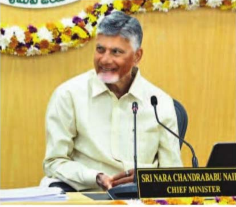
సంగతులను సీఎం గుర్తుచేసుకున్నారు. 'కాటేజీ రోజుల్లో రాయల్ ఎన్ఫీల్డ్ డ్రైవ్ చేశా.. ఇప్పుడు ఆ సంస్థను ఏపీకి తెచ్చాం' అంటూ ఆనాటి జ్ఞాపకాలను చంద్రబాబు పంచుకున్నారు.

అమరావతి, మే 8 : ఏపీకి ప్రపంచ ప్రఖ్యాత ఐకానిక్ మోటార్ సైకిల్ బ్రాండ్ 'రాయల్ ఎన్ఫీల్డ్' రాబోతోంది. తిరుపతిలో రూ.2,500 కోట్లతో మోటార్ సైకిల్ తయారీ పరిశ్రమను రాయల్ ఎన్ఫీల్డ్ సంస్థ ఏర్పాటు చేయనుంది. ఏపీకి రాయల్ ఎన్ఫీల్డ్ రాకపై ముఖ్యమంత్రి చంద్రబాబు నాయుడు ఎక్స్ లో పోస్ట్ చేశారు. 'రాయలసీమ ఇప్పుడు రాయల్ సీమ' అనే టైటిల్ తో రాయల్ ఎన్ఫీల్డ్ బైక్ ఉన్న ఫోటోను సీఎం చంద్రబాబు షేర్ చేశారు. ఈ ఫోటోకి 'రాయలసీమకు దూసుకువస్తున్న రాయల్ ఎన్ఫీల్డ్' అంటూ క్యాప్షన్ పెట్టారు. రెండు రోజుల క్రితం సీఎం చంద్రబాబు అధ్యక్షతన జరిగిన 17వ రాష్ట్రస్థాయి పెట్టుబడుల ప్రోత్సాహక బోర్డు(ఎస్ఐపీబీ).. రాయల్ ఎన్ఫీల్డ్ తయారీ పరిశ్రమకు గ్రీన్ సిగ్నల్ ఇచ్చింది. ఈ ప్రాజెక్ట్ కోసం సత్యవేడు పరిధిలోని వన్నె లూరు, రాళ్లకుప్పం గ్రామాల్లో సుమారు 267 ఎకరాల భూమిని ప్రభుత్వం కేటాయించింది. ఈ పరిశ్రమ ద్వారా సుమారు 5,000 మంది యువతకు ప్రత్యక్షంగా, పరోక్షంగా ఉపాధి అవకాశాలు లభించనున్నాయి. గురువారం జరిగిన కలెక్టర్ల సమావేశంలోనూ ఏపీకి రాయల్ ఎన్ఫీల్డ్ సంస్థ రావడంపై సీఎం చంద్రబాబు సంతోషం వ్యక్తం చేశారు. కాటేజీ రోజుల్లో బుల్ టి బండి నడిపిన