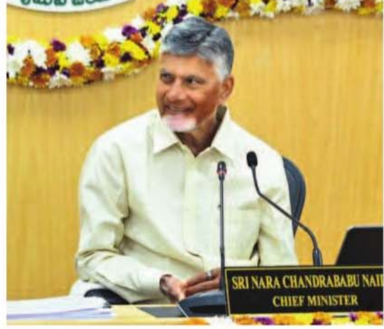
సంగతులను సీఎం గుర్తుచేసుకున్నారు. 'కాలేజీ రోజుల్లో రాయల్ ఎన్ఫీల్డ్ డ్రైవ్ చేశా.. ఇప్పుడు ఆ సంస్థను ఏపీకి తెచ్చాం' అంటూ ఆనాటి జ్ఞాపకాలను చంద్రబాబు పంచుకున్నారు.

అమరావతి, మే 8 : ఏపీకి ప్రపంచ ప్రఖ్యాత ఐకానిక్ మోటార్ సైకిల్ బ్రాండ్ 'రాయల్ ఎన్ఫీల్డ్' రాబోతోంది. తిరుపతిలో రూ.2,500 కోట్లతో మోటార్ సైకిల్ తయారీ పరిశ్రమను రాయల్ ఎన్ఫీల్డ్ సంస్థ ఏర్పాటు చేయనుంది. ఏపీకి రాయల్ ఎన్ఫీల్డ్ రాకపై ముఖ్యమంత్రి చంద్రబాబు నాయుడు ఎక్స్ లో పోస్ట్ చేశారు. 'రాయలసీమ ఇప్పుడు రాయల్ సీమ' అనే బైటిల్ తో రాయల్ ఎన్ఫీల్డ్ బైక్ ఉన్న ఫోటోను సీఎం చంద్రబాబు షేర్ చేశారు. ఈ ఫోటోకి 'రాయలసీమకు దూసుకువస్తున్న రాయల్ ఎన్ఫీల్డ్' అంటూ క్యాప్షన్ పెట్టారు. రెండు రోజుల క్రితం సీఎం చంద్రబాబు అధ్యక్షతన జరిగిన 17వ రాష్ట్రస్థాయి పెట్టుబడుల ప్రోత్సాహక బోర్డు(ఎస్ బిపీబీ).. రాయల్ ఎన్ఫీల్డ్ తయారీ పరిశ్రమకు గ్రీన్ సిగ్నల్ ఇచ్చింది. ఈ ప్రాజెక్ట్ కోసం సత్యవేడు పరిధిలోని వన్నెలూరు, రాళ్లకుప్పం గ్రామాల్లో సుమారు 267 ఎకరాల భూమిని ప్రభుత్వం కేటాయించింది. ఈ పరిశ్రమ ద్వారా సుమారు 5,000 మంది యువతకు ప్రత్యక్షంగా, పరోక్షంగా ఉపాధి అవకాశాలు లభించనున్నాయి. గురువారం జరిగిన కలెక్టర్ల సమావేశంలోనూ ఏపీకి రాయల్ ఎన్ఫీల్డ్ సంస్థ రావడంపై సీఎం చంద్రబాబు సంతోషం వ్యక్తం చేశారు. కాలేజీ రోజుల్లో బులెట్ బండి నడిపిన