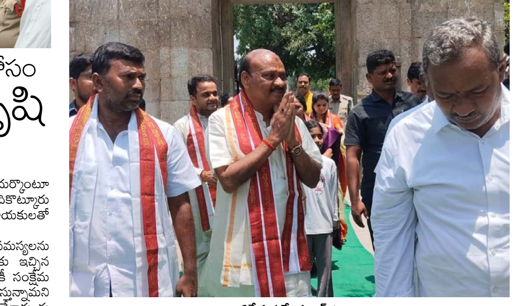
పర్యటన ఉత్తేజిత జూన్ 1.