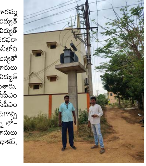
శ్రీకాకహస్తి, జూన్ 1 ఉత్తేజిత: