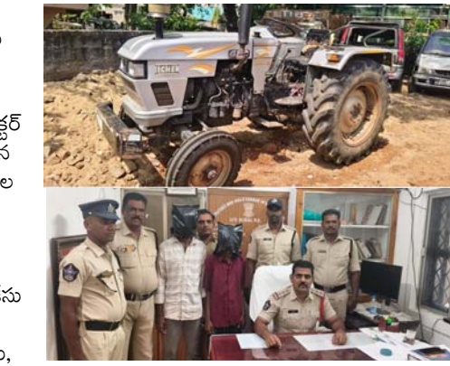
శ్రీకాకహస్తి, జూన్ 1 ఉత్తేజిత