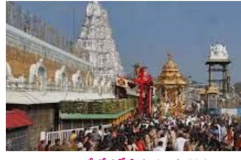
అభిషేకసమయంలో సామాన్యులకు దర్శనం