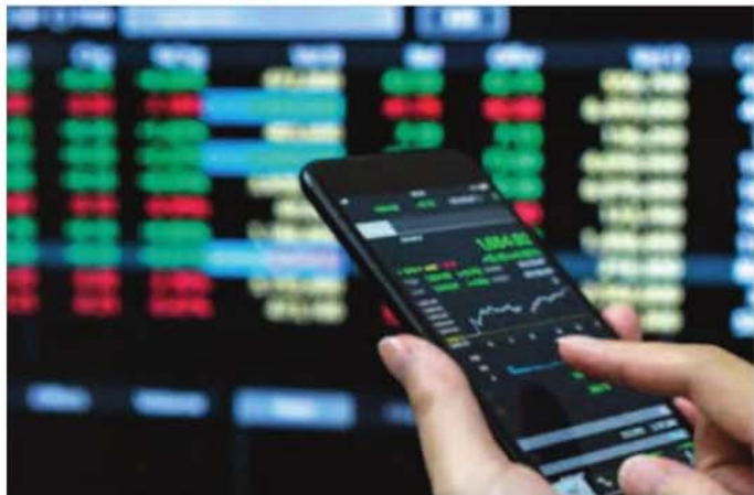
అంతర్జాతీయ వివరణలో ట్రెంట్ క్రూడ్ 104 డాలర్ల వద్ద ట్రేడవుతుండగా.. బంగారం షెన్సు 4518 డాలర్ల వద్ద కొనసాగుతోంది.

ముంబయి: దేశీయ స్టాక్ మార్కెట్ సూచీలు సప్తాల్లో ముగిశాయి. బి.సీ, ఎఫ్.ఎం.సీ.జీ స్టాక్స్ పై ఒత్తిడి కారణంగా సూచీలు ప్రభావితమయ్యాయి. ఉదయం లాభాల్లో ప్రారంభమైన సూచీలు.. చివరికి నష్టాల్లోకి జారుకున్నాయి. సెన్సెక్స్ 135.03 పాయింట్లు నష్టపోయి 75,183.36 పాయింట్ల వద్ద ముగియగా.. నిఫ్టీ 4.30 పాయింట్ల నష్టంతో 23,654.70 వద్ద స్థిరపడింది. అరబీబిఐ రంగ ప్రవేశంతో డాలరుతో రూపాయి విలువ 63 పైసలు బలపడి 96.23కు చేరుకుంది. ఉదయం 75,732.42 పాయింట్ల వద్ద (క్రీతం ముగింపు 75,318.39) లాభాల్లో ప్రారంభమైన సూచీ.. ఇంట్రాడేలో 74,996.78 - 75,945.79 మధ్య కదలాడింది. సెన్సెక్స్ 30 సూచీలో బజాజ్ ఫైనాన్స్, బిక్ మూవీలైలా, హిందుస్థాన్ యూనిలివర్, ఇన్ఫోసిస్, బజాజ్ ఫినిసర్స్ షేర్లు ప్రధానంగా నష్టపోయాయి. ఇండిగో, బీతాఎల్, ట్రెంట్, అదానీ పోర్ట్స్, అల్రాటెక్ సిమెంట్ షేర్లు లాభపడ్డాయి.