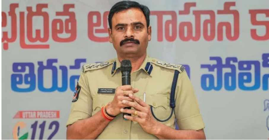
రేణిగుంట మే 22 ఉత్తేజ బ్యూరో