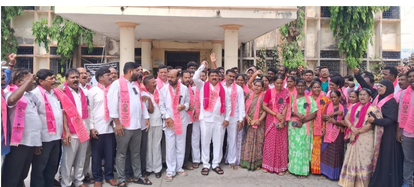
రోడ్ల కట్టాలు, ప్రభుత్వ భూముల రిజిస్ట్రేషన్ల వంటి అంశాలపై పోరాటం నిరంతరం కొనసాగుతుందని చెప్పారు. "విమానం నా కోసం ఆగింది.. నా పవర్ ఏంటో చూపిస్తా" అంటూ అధికారులు, ఉద్యోగులను భయభ్రాంతులకు గురిచేస్తున్న తీరును ఆయన తప్పుబట్టారు.

కార్పొరేషన్లో కమీషన్ల దందా పరాకాష్ఠకు చేరిందని నరేందర్ ఆరోపించారు. "కొందరు నేతలకు 6 లక్షల నుంచి అయితే 6 శాతం, మరికొందరికి 9 లక్షల నుంచి అయితే 9 శాతం కమీషన్లు వసూలు చేస్తున్నారు. చివరకు బదిలీల కోసం కూడా కమీషన్లు అడుగుతున్న దౌర్భాగ్య స్థితి నెలకొంది" అని ఎద్దేవా చేశారు.