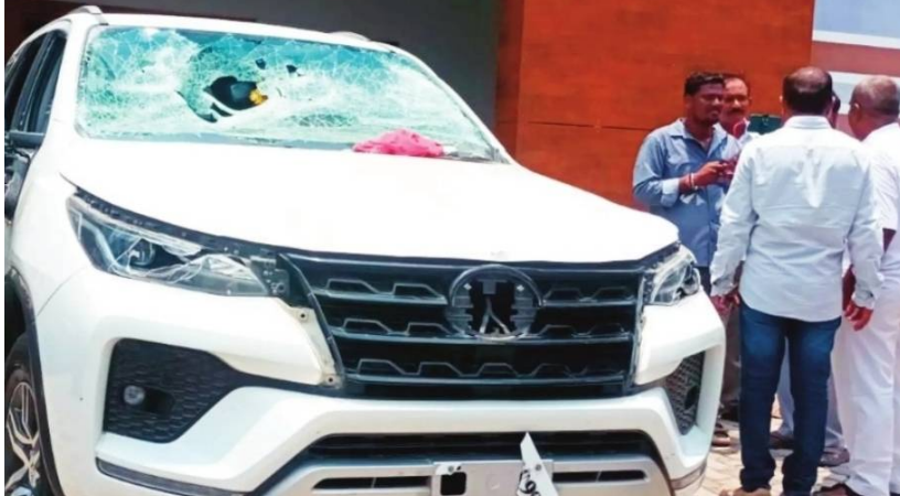
పుతంగని, బండి సంజయ్ నేరుగా అడుపులో పెట్టుకొని మాట్లాడాలని హెచ్చరించారు. గతంలో ఆయన తన భార్యపై అనుచిత వ్యాఖ్యలు చేశారని, ఎన్నికల్లో బట్టలు ఊడదీస్తూ, బిస్కాక్లని పట్టుకుని వెంటపడతానని అన్నారు ఆగ్రహం వ్యక్తం చేశారు. కేటీఆర్ పై నోటికొచ్చినట్లు మాట్లాడితే ఊరుకోవేదీ లేదని హెచ్చరించారు. ఘటనపై పోలీసులు కేసు నమోదు చేసి దర్యాప్తు చేపట్టారు. కరీంనగర్ లో ఉద్రిక్తత నెలకొనడంతో భారీగా పోలీసులు మోహరించారు

కరీంనగర్, మే 7 (వార్త నిర్వయం): కరీంనగర్ లో హైటెక్ వాహనం నెలకొంది. కేంద్ర మంత్రి బండి సంజయ్ పూజారాజ్ ఎమ్మెల్యే పాడి కౌశిక్ రెడ్డి చేసిన అనుచిత వ్యాఖ్యల నేపథ్యంలో కేంద్ర మంత్రి అనుచరులు, బీఆర్ఎస్ ఎమ్మెల్యే గంగుల కమలాకర్ అనుచరుల మధ్య ఘర్షణ చోటు చేసుకుంది. ఈ క్రమంలో ఆగ్రహంతో ఊగిపోయిన పాడి కౌశిక్ రెడ్డి కారుపై రాళ్లతో దాడి చేయడంతో కారు అడ్డంకు పూర్తిగా ధ్వంసమయ్యాయి. ఘటనాస్థితికి చేరుకున్న పోలీసులు పరిస్థితిని అదుపులోకి తెచ్చేందుకు తీవ్రంగా ప్రయత్నించినా ఫలితం లేకుండా పోయింది. వ్యాఖ్యల వెనుక తీసుకోవాలని డిమాండ్. బండి సంజయ్ పై చేసిన వ్యాఖ్యలను పాడి కౌశిక్ రెడ్డి వెనక్కి తీసుకోవాలని, వెంటనే క్షమాపణ చెప్పాలని డీవీకే నేతలు డిమాండ్ చేశారు. క్యాంప్ ఆఫీస్ వద్దకు భారీగా చేరుకున్న ఆందోళనకారులను అడ్డుకునేందుకు పోలీసులు తీవ్రంగా ప్రయత్నించారు. ఈ సందర్భంగా జరిగిన తోపులాటలో పలువురికి స్వల్ప గాయాలైనట్లు తెలుస్తోంది. పరిస్థితి అదుపు చేప్పకుండా పోలీసులు లాఠీఛార్జ్ చేసి వారిని చెదరగొట్టారు. కౌశిక్ రెడ్డి ఏమన్నారో కరీంనగర్ లో పూజారాజ్ బీఆర్ఎస్ ఎమ్మెల్యే పాడి కౌశిక్ రెడ్డి ఉదయం ప్రెస్ మీట్ నిర్వహించి కేంద్ర మంత్రి బండి సంజయ్ పై తీవ్ర విమర్శలు చేశారు. తనపై అనవసరంగా దాడికి పాల్పడ్డారని, నోటికొచ్చినట్లు మాట్లాడుతూ తమను