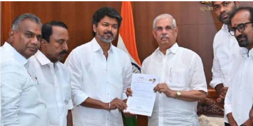
జరుపుతున్నారు. అసెంబ్లీలో మెజారిటీ నిరూపించుకున్నాకే ప్రభుత్వం కొనసాగే అవకాశం ఉంటుంది. అప్పటి వరకు రాజకీయంగా ఉత్సాహం కొనసాగే అవకాశం ఉంది.

హైదరాబాద్, మే 7 (వార్త నిర్వయం): తమిళనాడులో ప్రభుత్వ ఏర్పాటుపై రోజుకో కీలక పరిణామం చోటు చేసుకుంటోంది. అసెంబ్లీ ఎన్నికల్లో అత్యధిక స్థానాలు గెలుచుకున్న డీవీకే అధినేత విజయ్, రాష్ట్రంలో కొత్త ప్రభుత్వాన్ని ఏర్పాటు చేయబోతున్నట్లు సమాచారం. లోక్ సభలో గవర్నర్ రాజేంద్ర విశ్వనాథ్ అధికారంలో జరిగిన భేటీ అనంతరం ప్రభుత్వ ఏర్పాటుకు గవర్నర్ గ్రీన్ సిగ్నల్ ఇచ్చినట్లు సమాచారం. ఈ మేరకు ముందు అనుకున్న ప్రకారమే ఇవాళే ముఖ్యమంత్రిగా విజయ్ ప్రమాణ స్వీకారం ఉంటుందని డీవీకే పర్సనల్ అంట్ల న్యాయవాది అయితే మ్యాజిక్ ఫిగర్ కంటే తక్కువగా ఉన్న 112 మంది ఎమ్మెల్యేలతో ప్రభుత్వాన్ని ఎలా ఏర్పాటు చేస్తారని గవర్నర్ ప్రశ్నించినట్లు తెలిసింది. ప్రభుత్వానికి మరేదైనా పార్టీ మద్దతు ఇస్తుందా అని కూడా అడిగినట్లు సమాచారం. సీఎం పదవి చేపట్టిన తర్వాత అసెంబ్లీలో మెజారిటీ నిరూపించుకోగలనని విజయ్ అన్నట్లు డీవీకే పర్సనల్ అంట్ల న్యాయవాది దీంతో మద్దతు కూడగట్టేందుకు చిన్న పార్టీల నేతలతో డీవీకే ముఖ్య నాయకులు వరుసగా మంతనాలు