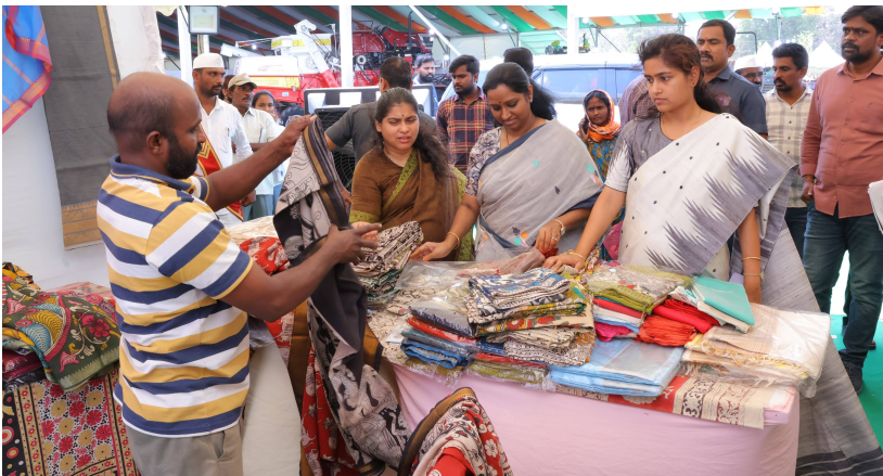
తీసుకుంటోందని, చేనేత రంగానికి మరింత ప్రోత్సాహం అందించేందుకు పలు పథకాలు అమలు చేస్తోందన్నారు. స్థానికంగా తయారయ్యే చేనేత ఉత్పత్తులకు ఆదరణ పెరిగితే నేతన్నల కుటుంబాలు ఆర్థికంగా మరింత బలోపేతం అవుతాయని తెలిపారు.