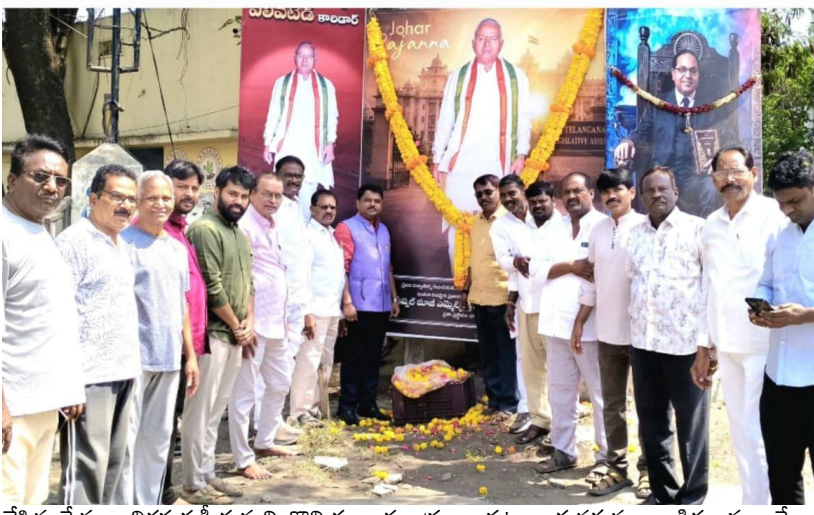
చేసిన సేవలు చిరస్మరణీయమని కొనియాడారు. ప్రజల పట్ల ఆయనకున్న అంతిమభావం, సేవా తత్వం నేటి తరానికి ఆదర్శమని పేర్కొన్నారు.