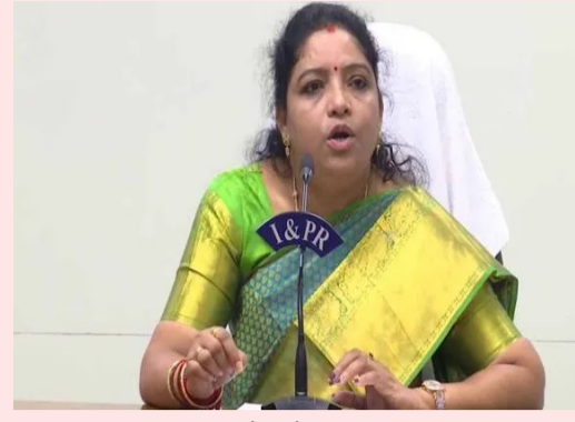
తెలిపారు. ఉత్తరాంధ్రకు రైల్వే జోన్ సాధించడం కూటమి ప్రభుత్వ చరిత్రాత్మక విజయంగా చెప్పుకోవచ్చు. యువత చేతిలో ఆయుధాలు

అమరావతి, మే 9: విధ్వంసం పాలన నుంచి వికాసం పాలన వైపు రాష్ట్రాన్ని ముఖ్యమంత్రి చంద్రబాబు నాయుడు ముందుకు తీసుకెళ్తున్నారని మంత్రి గుమ్మడి సంధ్యారాణి అన్నారు. శనివారం మీడియాతో మాట్లాడుతూ... 23 నెలల కుట్రలకు పాలనలో భయపెట్టే రాజకీయాలకు ముగింపు పలికి, భరోసా కలిగించే పరిపాలన అందుతోందన్నారు. వైసీపీ హయాంలో ప్రజల నమస్కరణలను చెప్పుకోవడానికే భయపడేవారని.. నేడు ప్రజలకు అందుబాటులో ఉన్న ప్రభుత్వం పనిచేస్తోందని తెలిపారు. వైజాగ్ అంటే ఒక్కప్పుడు గంజాయి గుర్తొచ్చేదని.. నేడు గుగూర్, డీసీఎస్ వంటి ప్రపంచ స్థాయి సంస్థలు గుర్తుకొస్తున్నాయని మంత్రి అన్నారు. అరకు, పాడేరు ప్రాంతాల్లో గంజాయి తోటల స్థానంలో కాఫీ తోటలు విస్తరిస్తున్నాయని