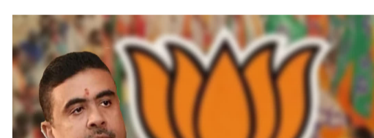
కామ్రస్, బైర్ల కులాలు ఉన్నాయి. బంగాల్ రాజకీయాలను దశాబ్దాల పాటు భద్రలోకి వర్గం నేతలే కాసించారు. జ్యోతి బసు నుంచి మమతా బెనర్జీ వరకు సీఎంలు అయిన వారిలో సింహభాగం మంది భద్రలోకి వర్గంయే. మమతా బెనర్జీ బంగాలీ బ్రాహ్మణ కుటుంబంలో జన్మించారు. జ్యోతి బసు సంపన్న బంగాలీ కామ్రస్ కుటుంబంలో జన్మించారు. ఇప్పుడు బీజేపీ బంగాల్ రాజకీయాల్లో కొత్త ఒరవడికి త్రీకారం చుట్టింది. సీఎం పదవిని తొలిసారిగా ఓడీసీ వర్గం నేత సువేందు అధికారికి కేటాయించింది. ఈ అసెంబ్లీ ఎన్నికల్లో తమ పార్టీని ఆశీర్వదించిన ఓడీసీ రుజాన్ కు బీజేపీగా కమలదళం తీర్చుకుంటోంది. తాము భద్రలోకి వర్గానికి సంబంధం కాదని, అన్ని వర్గాలకూ రాజకీయ అవకాశాల్ని కల్పిస్తామనే సంకల్పాన్ని పెద్దమ్మల్ కులా(ఎస్సీ) కేటగిలోని సమకూర్ (మతుకు), రాజబన్సీ వర్గాల్లోకి వసించి, రాష్ట్రంలోని మొత్తం 294 అసెంబ్లీ స్థానాల్లో సుమారు 80 నుంచి 100 సీట్లతో గెలుపొందుమలను సమకూర్ (మతుకు), రాజబన్సీ వర్గాల్లో నిర్ణయిస్తాము. ఈ రెండు కీలక వర్గాల మద్దతు లభించబట్టే ఈ ఎన్నికల్లో బీజేపీ 207 సీట్లను గెలుకోగలిగింది.