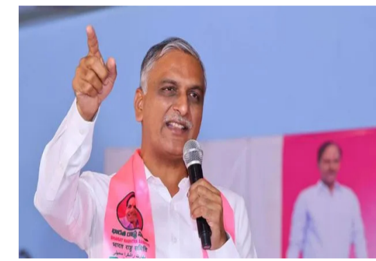
పార్టీస్ రావు ఆగ్రహం వ్యక్తం చేశారు.