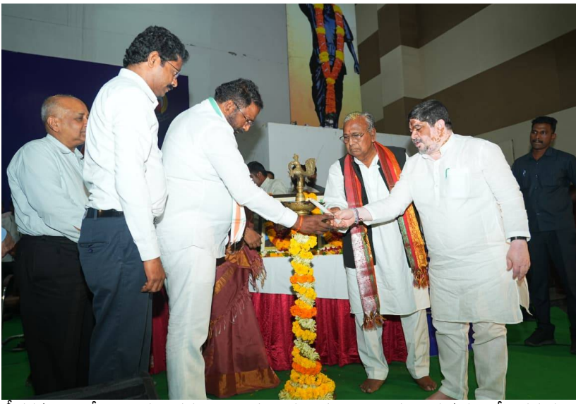
దీవెనకు బదిలీలు, ప్రమోషన్లు ఇచ్చామన్నారు. అవకాశాన్ని సృష్టించుకున్నవాళ్లే సమర్థులు అవుతారని, రాజకీయాలు అనగానే ఒక ధోరణిని విడనాడాలన్నారు. భవిష్యత్ లో విద్యార్థులు అసెంబ్లీ, పార్లమెంటుకు ఎన్నికై చట్టాలు చేయాలని, రాజకీయ నాయకులు చేసే చట్టాలు దేశ భవిష్యత్తును మారుస్తాయని అన్నారు. సీఎం రేవంత్ రెడ్డి విద్యారంగంలో విప్లవాత్మక మార్పులు తీసుకువచ్చేందుకు కృషి చేస్తున్నారని, ప్రజా ప్రభుత్వం విద్యార్థుల కోసం ఇస్తున్న ప్రాధాన్యతను గుర్తించి అవకాశాలను సద్వినియోగం చేసుకోవాలని పిలుపునిచ్చారు.