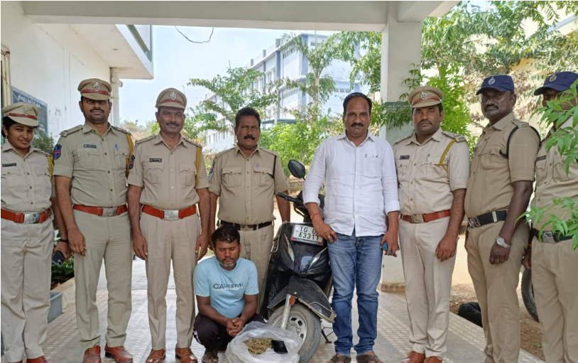
ప్రజలు అప్రమత్తంగా ఉండాలని అధికారులు సూచించారు.గంజాయి అక్రమ రవాణా, విక్రయాలపై సమాచారం ఉంటే 9030019943, 8712658861 సంబంధిత తెలపాలని ఎక్స్ట్రేజ్ శాఖ విజ్ఞప్తి చేసింది.