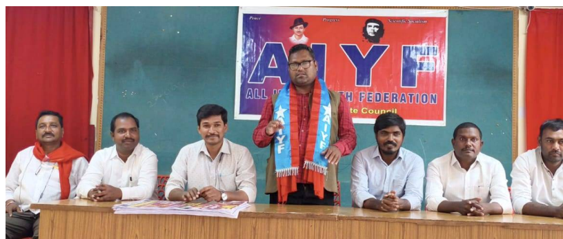
అవమానించడమేనని పేర్కొన్నారు. "కాక్రోచెస్ జనతా పార్టీ" సామాజిక మాధ్యమ ఖాతాలను నిలిపివేయడం తీవ్రంగా ఖండించుమని ాశ్రీ నేతలు అన్నారు. ప్రజాస్వామ్యంలో వ్యంగ్యం, విమర్శ, నిరసన వ్యక్తీకరణ రాజ్యాంగబద్ధ హక్కులని గుర్తుచేశారు. భారత రాజ్యాంగంలోని ఆర్టికల్ 19(1)(g) ప్రతి పౌరుడికి భావ వ్యక్తీకరణ స్వేచ్ఛను హామీ ఇస్తుందని పేర్కొన్నారు. యువత తమపై జరిగిన అవమానానికి స్పందిస్తూ సోషల్ మీడియా వేదికగా అభిప్రాయాలు వ్యక్తం చేస్తే, వాటిని అణచివేయడం రాజ్యాంగ స్ఫూర్తికి విరుద్ధమన్నారు. ప్రశ్నించే గొంతులను ఖాళీ చేయడం, వ్యంగ్యాన్ని కూడా భరించలేని స్థితికి వ్యవస్థలు చేరడం ఆందోళనకరమని పేర్కొన్నారు. ప్రజాస్వామ్యంలో అసమ్మతి స్వరం దేశద్రోహం కాదని స్పష్టం చేశారు. సోషల్ మీడియా ఖాతాలను నిలిపివేయడం ద్వారా యువత ఆవేదనను అణచలేరని హెచ్చరించారు. అందువల్ల "కాక్రోచెస్ జనతా పార్టీ" సామాజిక మాధ్యమ ఖాతాలను వెంటనే పునరుద్ధరించాలని, భావ వ్యక్తీకరణ హక్కులపై జరుగుతున్న దాడులను నిలిపివేయాలని ాశ్రీ తెలంగాణ రాష్ట్ర సమితి డిమాండ్ చేసింది. దేశ యువత అత్యగౌరవాన్ని దెబ్బతీసే వ్యాఖ్యలను తీవ్రంగా ఖండిస్తున్నామని, యువత ఎందుకు ఈ స్థాయిలో ఆవేదన చెందుతున్నారో పాలకులు, వ్యవస్థలు అత్యపరిశీలన చేసుకోవాలని ాశ్రీ నాయకులు సూచించారు. ఉద్యోగాలు ఇప్పటిని ప్రభుత్వం, న్యాయం అందించలేని వ్యవస్థ, భవిష్యత్తుపై భరోసా కల్పించలేని పాలకులు ఇప్పుడు యువత గౌరవాన్నే అవమానించే స్థితికి దిగజారడం దేశానికి మంచిది కాదన్నారు. న్యాయమూర్తి సూర్యకాంత్ దేశ యువతకు బహిరంగ క్రమావళి చెప్పాలని, ఇటువంటి అవమానకర వ్యాఖ్యలను వెంటనే ఉపసంహరించుకోవాలని ాశ్రీ తెలంగాణ రాష్ట్ర సమితి డిమాండ్ చేసింది.