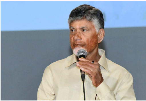
ఈ ఏడాది వైద్యరంగానికి రూ.19,305 కోట్లు కేటాయించామని, 15వ ఆర్థిక సంఘం నుంచి దేశంలోనే అత్యధికంగా రూ.2,601 కోట్ల ఆరోగ్య గ్రాంట్లు సాధించామని గుర్తుచేశారు. యూనివర్సల్ హెల్త్ పాలసీ కింద ప్రతి ఒక్కరినీ రూ.2.5 లక్షల విలువైన వైద్యం, ఎన్టీఆర్ వైద్య సేవ, సీఎం రిలీఫ్ ఫండ్ ద్వారా రూ.25 లక్షల వరకు ఖర్చులు భరిస్తామని హామీ ఇచ్చారు. ప్రకృతి బాగుంటేనే మనం బాగుంటామని,

ప్రెడిక్టివ్, ప్రెవెంటివ్, క్యూరేటివ్ విధానంలో ఈ ప్రాజెక్టును రూపొందించినట్లు తెలిపారు. గత జూలైలో కుప్పంలో పైలట్ ప్రాజెక్టుగా ప్రారంభించి, మార్చి 15 నుంచి చిత్రాపూ జిల్లా వ్యాప్తంగా అమలు చేస్తున్నట్లు చెప్పారు. జిల్లాలోని 19.75 లక్షల మంది ఆరోగ్యాన్ని కాపాడేలా చర్యలు తీసుకుంటున్నామని, ఆగస్టు 15 నుంచి రాష్ట్రవ్యాప్తంగా ఈ ప్రాజెక్టును ప్రారంభిస్తామని ప్రకటించారు. ఈ వధకంలో భాగంగా 42 రకాల వైద్య పరికరాలను ప్రజల ఇళ్ల వద్దే నిర్వహించి, రిపోర్టులు అందిస్తామన్నారు. డాక్టర్ అపాయింట్ మెంట్, వచ్చువల్ కనెక్ట్ ద్వారా వైద్య సలహాలు, వ్యక్తిగత ఆరోగ్య రికార్డుల డిజిటలైజేషన్ వంటి సేవలు అందిస్తున్నట్లు వివరించారు. త్వరలోనే ఏటా డాక్టర్ ద్వారా కూడా వైద్యసేవలు అందించేందుకు చర్యలు తీసుకుంటున్నామని తెలిపారు. ప్రతి వ్యక్తికి ఒక ఏటా డాక్టర్ ఉంటాడని స్పష్టం చేశారు. వైద్య ఖర్చుల భారం నుంచి కుటుంబాలను గట్టిపెంచడమే ప్రభుత్వ లక్ష్యమని, విద్య, వైద్య రంగాలకు ప్రజా ప్రభుత్వం అత్యధిక ప్రాధాన్యత ఇస్తుందని చంద్రబాబు స్పష్టం చేశారు.