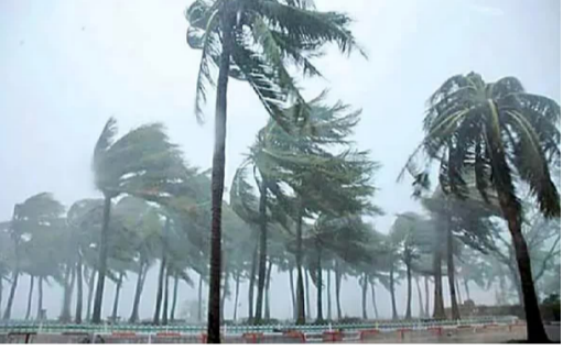
ఉరుములు మెరుపులతో కూడిన వర్షం దాదాపు గంట పాటు కురువడంతో లోతట్టు ప్రాంతాలు జలమయమయ్యాయి. కొన్ని ప్రాంతాల్లో మురుగు రోడ్డుపైకి చేరి వాహన రాకపోకలు స్తంభింపాయి. విద్యుత్ అంతరాయం ఏర్పడటంతో విద్యుత్ అధికారులు ఉదయన్నా ఆయా ప్రాంతాలకు చేరుకొని మరమ్మతులు చేపట్టారు. నగరపాలక సంస్థ అధికారులు కూటిన చెట్లను తొలగించే ప్రయత్నం చేస్తున్నారు. తీవ్ర ఎండలతో ఉక్కిరి బిక్కిరి అయిన ప్రజలకు రాత్రి కురిసిన వర్షం కాస్త ఉపశమనాన్ని కలిగించింది. అయితే ఎక్కడా ప్రాణ నష్టం జరగలేదు. కొన్ని ప్రాంతాల్లో చెట్లు కూలి రోడ్లకు అడ్డంగా ఏర్పడ్డాయి.

వర్షం వడసేస్తున్న చెన్నై ప్రాంతాలు, హోర్సింగ్లం కింద నిలబడవద్దని సూచించి, ప్రజలు అప్రమత్తంగా ఉండాలన్న రాష్ట్ర విపత్తు నిర్వహణ సంస్థ సూచించింది. మరోవైపు ఎలనివో ప్రభావంతో వాతావరణంలో మార్పులు జరుగుతున్నాయి. రాష్ట్రమంతా భూమి భగ్గలుకు మండిపోతుంటే మరొకప్పుడు ప్రాంతాల్లో భారీ వర్షాలు కురుస్తున్నాయి. అనకాపల్లి జిల్లా సకల్పత్తి మండలంలో గాలివాన బీభత్సం సృష్టించింది. ఉదయం నుంచి తీవ్రమైన వడగాలులతో జనం అల్లాడిపోగా... సాయంత్రానికి ఒక్కసారిగా వాతావరణం మారిపోయింది. దాదాపు అరగంట పాటు ఎడతెరిపి లేకుండా ఈదురుగాలులతో కూడిన భారీవర్షం కురిసింది. పలు గ్రామాలలో ఈదురుగాలులకు భారీ చెట్లు, విద్యుత్ స్తంభాలు నేలకొరిగాయి. కొన్నిచోట్ల ఇళ్లు చెత్తైపోయాయి. ముకుందరాజుపేటలో ఇంటిపైకెత్తు రేకులు పడి ఇద్దరు మహిళలు గాయపడ్డారు. మామిడి, అరటి వంటి ఉద్యాన పంటలకు తీవ్ర నష్టం వాటిల్లిందంటూ రైతులు వాపోతున్నారు. కొన్ని ప్రాంతాల్లో చెట్లు కూలి రోడ్లకు అడ్డంకం : నిస్స(కుక్కవారం) అంతర్భాగం చిగ్గరలో తెల్లవారుజామున కురిసిన భారీ వర్షానికి కొన్ని ప్రాంతాల్లో భారీ వృక్షాలు నేలకొరిగాయి.