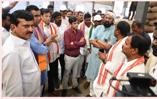
ఉపయోగించుకోవాలని అధికారులకు సూచించారు. ఇంకా లాభిలను నైతం ధాన్యం సరఫరాకు వారుకోవాలి తెలిపారు. 4వ తేదీ లోపు ధాన్యం, మక్కల కాంటన్ హౌస్లలో ధాన్యం కొనుగోలు చేసిన అధికారులను ఈ సందర్భంగా మంత్రి ఉత్తమ ఆదేశించారు. ధాన్యం

ఉత్తమ కుమార్ రెడ్డి స్పష్టం చేశారు. 8.5 లక్షల మంది రైతులకు రూ. 8,400 కోట్లు సగటు చెల్లించామన్నారు. తడిసిన ధాన్యాన్ని కూడా కొనుగోలు చేసి బ్యాంక్ లో బిల్లులకు తరలిస్తామని వెల్లడించారు. తడిసిన ధాన్యానికి ప్రతం కనీస మద్దతు ధర చెల్లిస్తామని ప్రకటించారు. ఇప్పటి వరకు 58 లక్షల మెట్రిక్ టన్నుల ధాన్యం కొనుగోలు చేశామని వివరించారు. గురువారం హనుమకొండలో పౌరసరఫరాల శాఖ మంత్రి పొంగలలేటి శ్రీనివాసరెడ్డితో కలిసి మంత్రి ఉత్తమ కుమార్ రెడ్డి సమీక్ష నిర్వహించారు. ఈ సందర్భంగా ఉత్తమ కుమార్ రెడ్డి మాట్లాడుతూ.. ధాన్యం కొనుగోలు చేసే పెంజాబిని ఈ సమీక్ష చేస్తున్నట్లు తెలిపారు. గన్నె బ్యాగుల కొరత లేదని చెప్పారు. జూన్ 4, 5వ తేదీల్లో రాష్ట్రంలోని రుతుపవనాల ప్రవేశంను మూల్యని వివరించారు. ధాన్యం తరలింపునకు అన్ని మార్గాలు