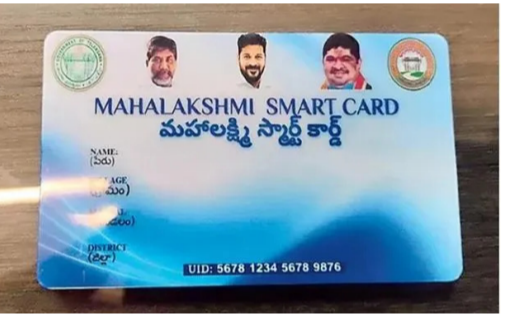
బస్సులో మహిళా ప్రయాణికుల సంఖ్య భారీగా పెరిగింది. కార్డులు జారీ దరఖాస్తు చేసుకునే విధానం, ఇతర వివరాలకు సంబంధించిన పూర్తి వివరాలను తెలుసుకోవడానికి, సమీప కార్డులు జారీ కేంద్రాన్ని కనుగొనడానికి టీఆర్ఎస్ ఆర్డీసీ అధికారిక వెబ్ సైట్ లో పూర్తి సమాచారం త్వరలో పొందవచ్చు. కార్డులు అందే వరకు అధికారి కార్డు చూపించి మహిళలకు ఉచితంగా ప్రయాణించవచ్చు.

ఇతర రాష్ట్రాల వారు సకీలీ అధికారి కార్డులతో ఈ పథకాన్ని దుర్వినియోగం చేస్తున్న ఘటనలను ఆంధ్రప్రదేశ్ ప్రభుత్వం ఈ నిర్ణయం తీసుకున్నది. బతుకు తెచ్చుకోవాలని పొరుగు రాష్ట్రాల నుంచి ఇక్కడికి వలస వచ్చిన వేలాది మహిళా కలిసి, పైసేటు ఉద్యోగులు, సకీలీ అధికారి సాయంతో బస్సులో ఉచితంగా ప్రయాణిస్తున్నారు. దీని వల్ల ఆర్డీసీ పెద్ద మొత్తంలో ఆదాయానికి గండి పడుతోంది. ఈ పథకం అమలులోకి వచ్చిన తర్వాత ఆర్డీసీ