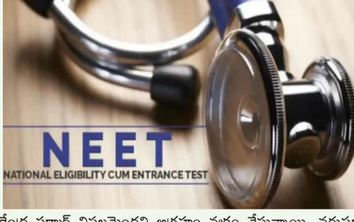
కేంద్ర సర్కార్ విఫలమైందని ఆగ్రహం వ్యక్తం చేస్తున్నారు. వరుసగా జరుగుతున్న సీట్ సేపర్ లీక్ కు ప్రభుత్వం ఉదాసీనత కారణమని కాంగ్రెస్ ఆగ్రహం, లోకసభలో విపక్ష నేత రాహుల్ గాంధీ దుయ్యబట్టారు. సీట్ సేపర్ లీక్ కు బాధ్యత వహించిన కేంద్ర విద్యాశాఖ

మే 3వ నేషనల్ టెస్టింగ్ ఏజెన్సీ (ఎన్ టీఎం) నిర్వహించిన సీట్-యూజ్ 2026 పరీక్షను సేపర్ లీక్ అయ్యిందన్న కారణంతో మే 12న రద్దు చేశారు. అనంతరం జూన్ 21న రీ-టెస్టింగ్ పరీక్షాపని కేంద్ర విద్యా శాఖ మంత్రి ధర్మేంద్ర ప్రధాన్ వెల్లడించారు. వచ్చే ఏడాది నుంచి సీట్ పరీక్ష ఆన్ లైన్ లో నిర్వహిస్తామని తెలిపారు. కాగా, మే 3న దేశంలోని 551 నగరాలు, విదేశాల్లోని 14 నగరాలలో మొత్తం 5,400కు పైగా కేంద్రాల్లో సీట్ యూజ్ పరీక్ష జరిగింది. 22 లక్షల మందికి పైగా అభ్యర్థులు ఈ ఎగ్జామ్ లో రాయారు. అయితే ప్రశ్నాపత్రంలో లీక్ కారణంగా ఎగ్జామ్ రద్దవుతుందో వారు మరోసారి జూన్ 21న పరీక్షను రాయున్నారు. మరోవైపు సీట్ యూజ్ సేపర్ లీక్ పై రాజకీయ పార్టీలు అప్రధానా మండిపడుతున్నాయి. పరీక్షల నిర్వహణలో