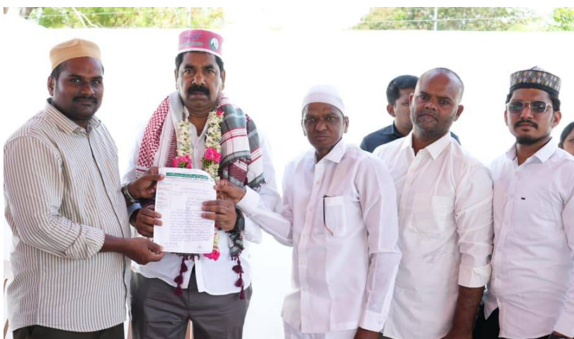
సుఖసంతోషాలతో ఉండాలని అల్లాసు ప్రార్థించారు. తెలంగాణ రాష్ట్రంలో పాలు వర్షపాతం నియోజకవర్గ ప్రజలందరికీ బక్రీడ్ శుభాకాంక్షలు తెలిపారు. ఈ కార్యక్రమంలో బనవోలు మండల ప్రజాప్రతినిధులు, కాంగ్రెస్ పార్టీ రాష్ట్ర, జిల్లా, మండల, గ్రామస్థాయి నాయకులు, ముస్లిం మత పెద్దలు, సోదరులు పెద్ద సంఖ్యలో పాల్గొన్నారు.