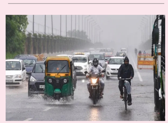
అమరావతి : మరోవైపు ఎల్ నిస్ ముప్పు తీవ్రంగా పొంది ఉంది.