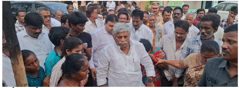
గోకవరం మే 30 (వార్త నిర్వహణ) గోకవరం మండలం తంటికొండ గ్రామంలో శుక్రవారం అగ్గరాత్రి తాటకు పాకలు అగ్నికి అహుతి అయినవి. కొత్తగా 3 నెలలు కింద నిర్మించిన అకల సత్తిబాబు టిఫెన్ హోటల్, జొన్న రాజా కిరాణి షాప్ పూర్తిగా అగ్నికి బూడిదైసినవి. శనివారం నాడు ఎమ్మెల్యే జ్యోతుల నెవ్రూ తంటికొండలో బాధితులను పరామర్శించారు. నష్టపోయిన వారికి సహాయం అందిస్తానని హామీ ఇచ్చారు. నష్టపోయిన వారికి ప్రభుత్వపరంగా సహాయం అందించాలని రెవెన్యూ అధికారులు