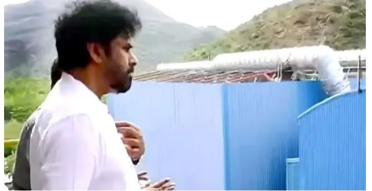
విద్యుత్ సరఫరా వృథా శాతం అత్యంత తక్కువగా ఉండటం విశేషమని డిప్యూటీ సీఎం ఈ సందర్భంగా ప్లాంట్ అధికారులు తెలియజేశారు.

గల అవకాశాలను పరిశీలించాలని సూచించారు. ఇందుకోసం దేశంలోనే అత్యంత పుష్కలమైన నగరంగా పేరొందిన 'ఇండోర్ మోడల్' తరహాలో చెత్తను పద్ధతిగా, పారదర్శకంగా వేరు చేసేలా కొత్త మార్గదర్శకాలను రూపొందించాలని అధికారులకు దిశా నిర్దేశం చేశారు. మరోవైపు.. ప్లాంట్ అధికారులు ఉప ముఖ్యమంత్రికి అంతర్జాతీయ, జాతీయ స్థాయి గజంకాలను వివరించారు. సింగపూర్ లో మొత్తం విద్యుత్ ఉత్పత్తిలో 2.8 శాతం కేవలం ఇలాంటి చెత్త ప్లాంట్ నుంచే లభిస్తోందని పవన్ కల్యాణ్ దృష్టికి తీసుకొచ్చారు. దీంతో పాటు ఆంధ్రప్రదేశ్ విద్యుత్ గ్రైడ్ లో ఈ వ్యర్థ ఆధారిత విద్యుత్ ప్లాంట్ల అనుసంధానం చాలా అవకాశంగా ఉందని అధికారులు ప్రకటించారు. దేశంలోని ఇతర రాష్ట్రాల్లో పోలిస్తే ఆంధ్రప్రదేశ్ లో